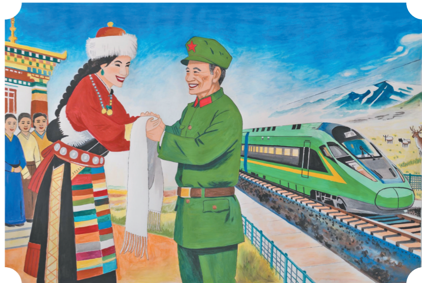
侯建宏作 哈达暖心,天路通高原(水彩) 作者单位:中铁二十局四公司