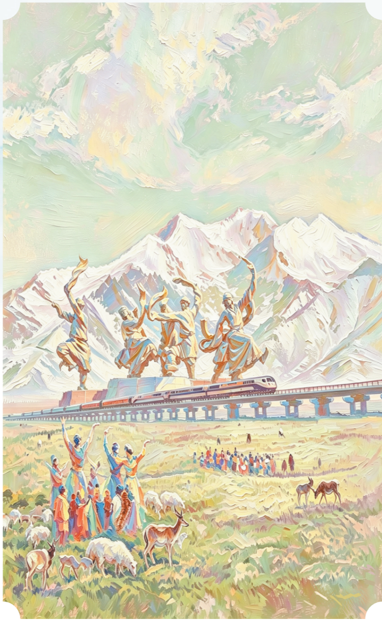
天路丰碑(油画) 殷鸣作 作者单位:中铁二十二局二公司