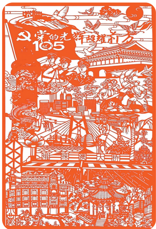
党的光辉照耀前方(剪纸) 刘雨时 作