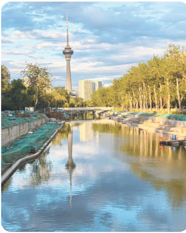
晚霞映京城