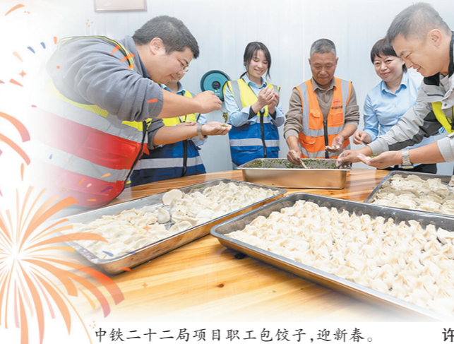
中铁二十二局项目职工包饺子，迎新春。