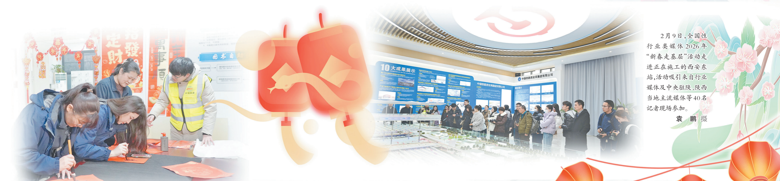
2月9日，全国性行业类媒体2026年“新春走基层”活动走进正在施工的西安东站，活动吸引来自行业媒体及中央驻陕、陕西当地主流媒体等40名记者现场参加。