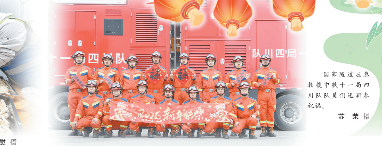
国家隧道应急救援中铁十一局四川队队员送新春祝福。