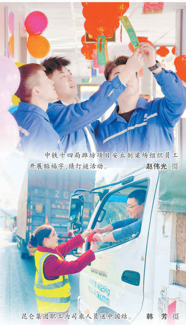
中铁十四局潍坊项目安丘制梁场组织员工开展贴福字、猜灯谜活动。

雄浑的太平鼓点，在新家园里响起。这个新春，榆中灾区的每一盏灯火都透着温暖，每一张笑脸都写满希望。