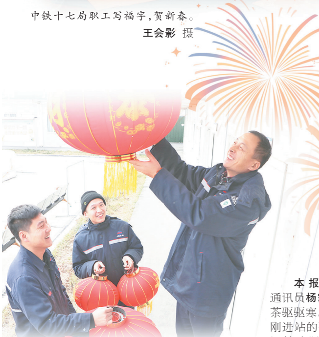
中铁十七局职工写福字，贺新春。