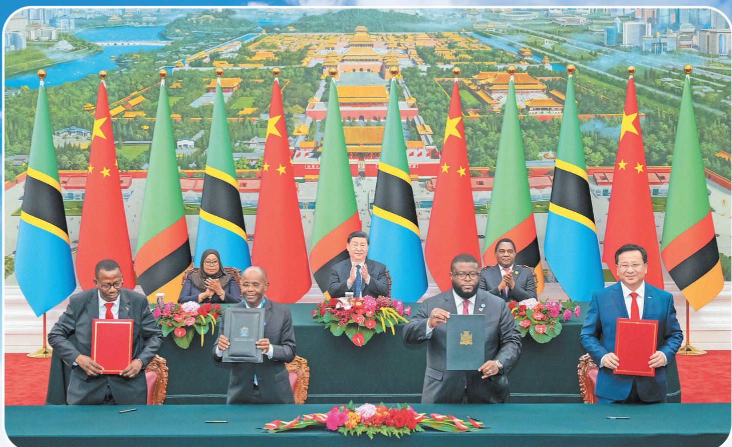
2024年9月4日上午,国家主席习近平在北京人民大会堂同来华出席中非合作论坛北京峰会的坦桑尼亚总统哈桑、赞比亚总统希奇莱马共同见证签署《坦赞铁路激活项目谅解备忘录》。

光影为笔,记录峥嵘足迹;长路作证,镌刻奋斗史诗。看!复兴之路正铺展,铁军雄风再扬帆,中国铁建将以这光影长卷为序章,肩扛山河,再筑辉煌!