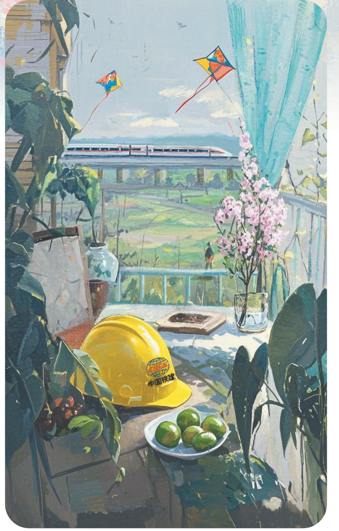
清风(油画) 殷鸣作 作者单位:中铁二十二局二公司