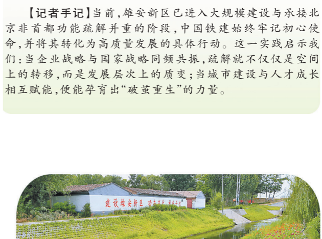
雄县隔碱沟治理项目。