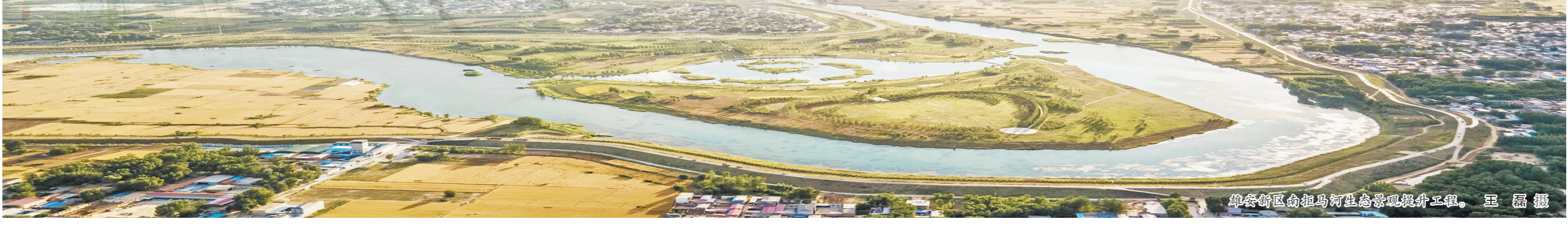
雄安新区南拒马河生态景观提升工程。