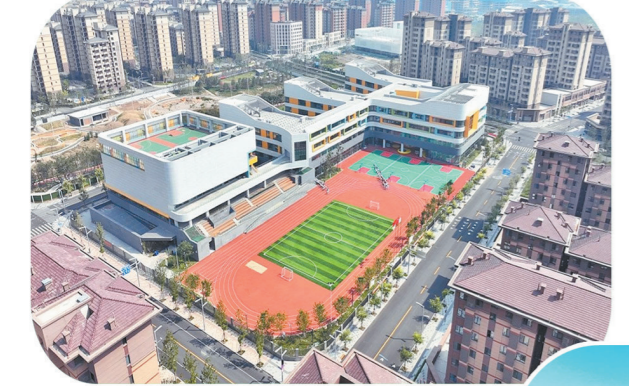
容东片区B2组团金源小学及安置房项目。

【记者手记】当光伏板捕捉阳光,当智造激活楼宇,中国铁建在雄安创新的每一步,都是新时代央企服务国家战略的缩影,他们用实践证明:践行嘱托的答案,既要写在汇报文件里,更要刻进城市基因中。