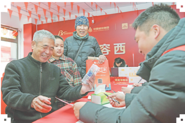
图为回迁群众在办理交房手续。