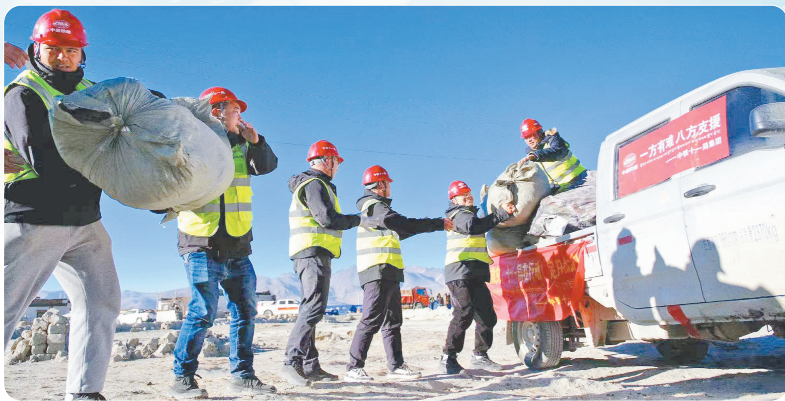
转移救援物资。

“新增的50间板房今天就能到拉孜县！”1月16日中午，吴东从电话那头传来好消息。