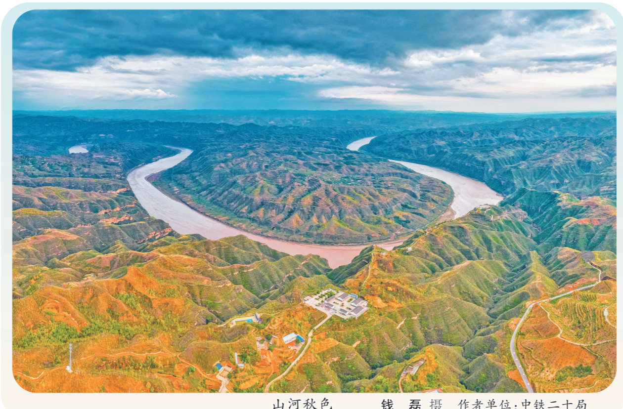
山河秋色 钱磊摄 作者单位:中铁二十局