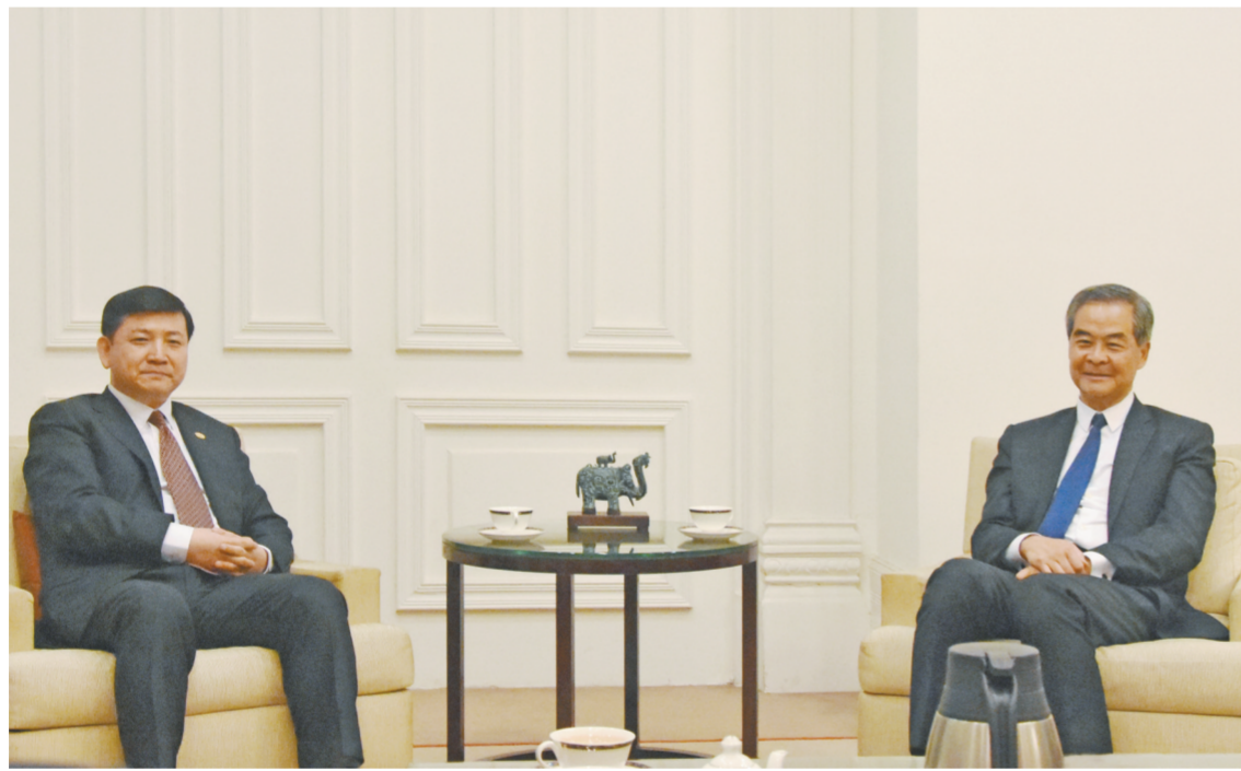
图为4月8日,王立新与全国政协副主席梁振英会谈。

在与金泽培会谈时,王立新表示,香港铁路有限公司是中国铁建在香港的重要合作伙伴,双方有着扎实的合作基础和广阔的合作空间。中国铁建愿意发挥专业优势,全方位、深层次参与香港铁路与轨道交通建设,与港铁携手拓展内地与国际市场,实现合作共赢。