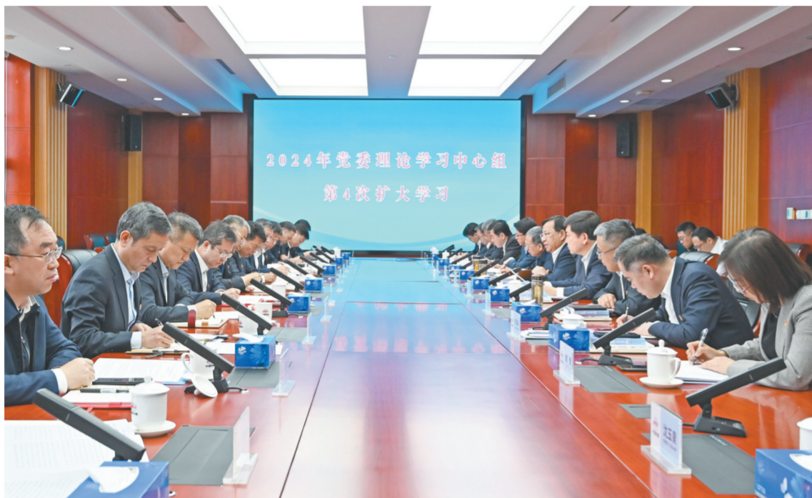
图为4月1日,中国铁建党委专题学习研讨习近平总书记近期重要讲话和重要论述精神。

中国铁建总部部门以上领导、各职能部门负责人参加学习,相关职能部门负责人作了研讨交流。