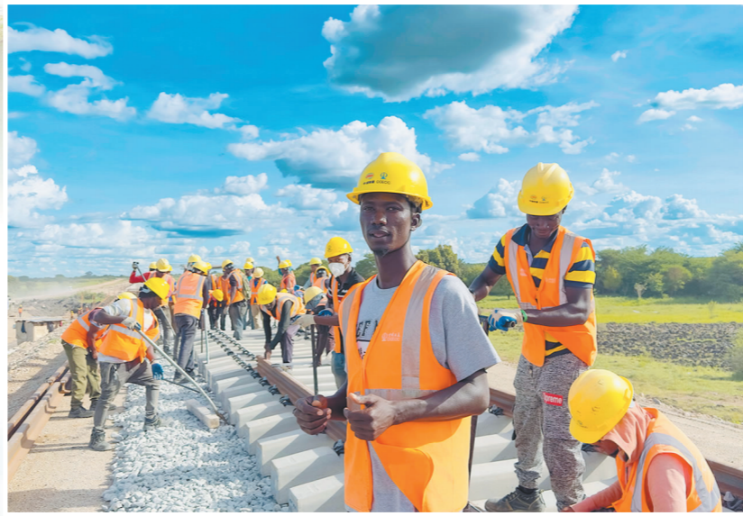
3月5日,中国土木坦桑尼亚中央线标轨铁路第五标段抢抓春季施工黄金时机,投入火热的施工中。图为建设者正在铺轨。