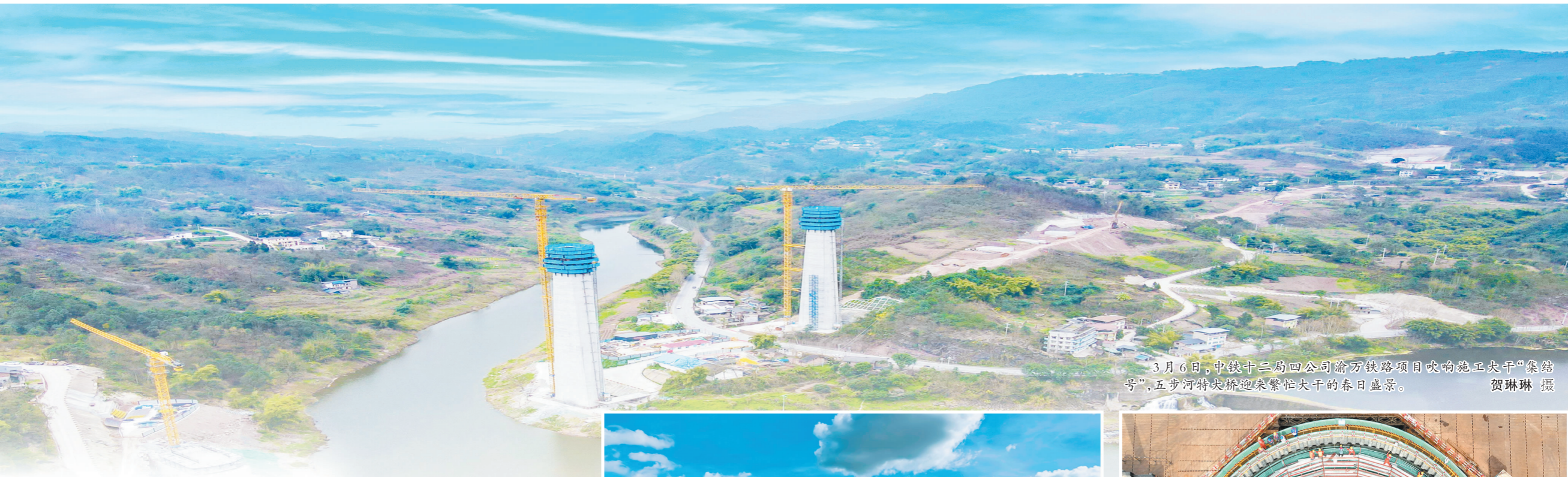
3月6日,中铁十三局四公司渝万铁路项目吹响施工大干“集结号”,五步河特大桥迎来繁忙大干的春日盛景。

穿山越岭、跨江越海,交通工程纵横大地;盾构掘进、高楼拔节,市政建设有力有序;管片成型、物流穿梭,车间产线智能制造……随着天气逐渐转暖,放眼海内外,中国铁建各单位锚定全年目标,在春天的号声中奏响了大干序曲,一派不负春光占先机、驭风前行拼开局的蓬勃气象。