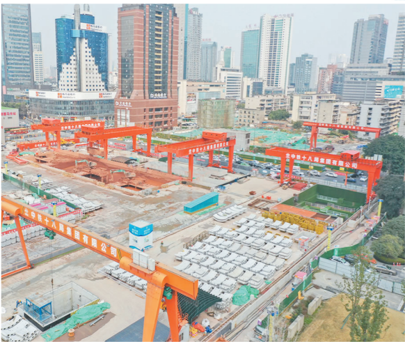
3月9日,由中铁十八局市政公司负责施工的成都轨道交通18号线火车北站~驷马市站区间左线“四盾齐进”,跑出成都市最深盾构区间建设“加速度”。图为正在建设中的驷马市站。