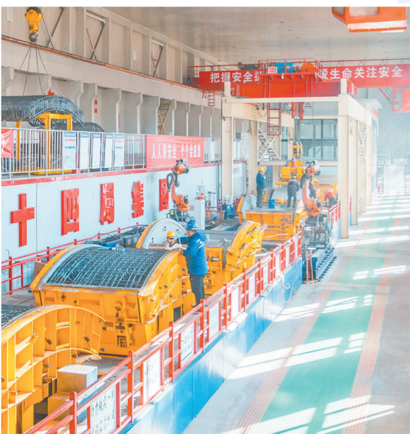
3月13日,在北京房山,中铁十四局房桥公司工人正在第五代管片智能生产线上争分夺秒地为京唐城际铁路预制管片。