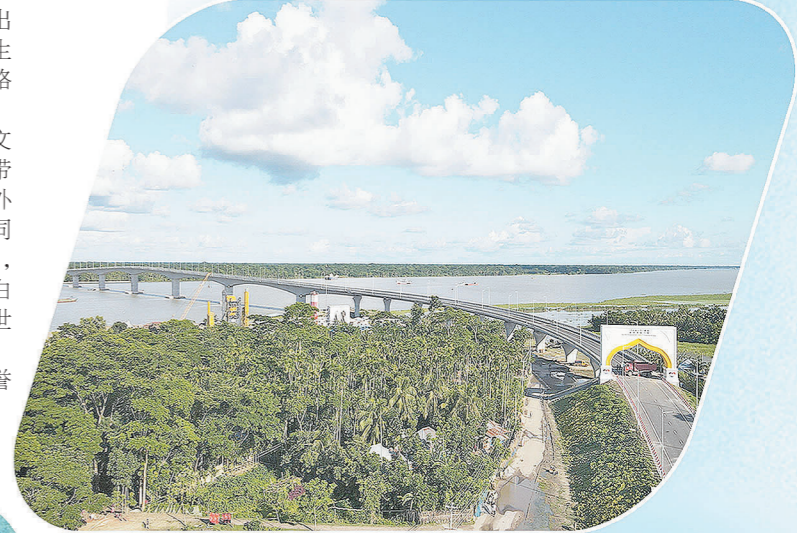
中铁十七局援孟加拉国孟中友谊大桥工程。

站在新的历史起点上,中国铁建正以敢谋新篇的勇气、敢于担当的作风,努力创造更大的经济和社会价值,奋力谱写建设“最值得信赖的世界一流综合建设产业集团”新篇章!