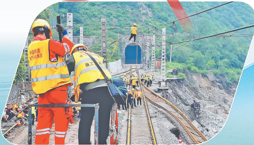
中铁建电气化局员工在铁路抢险现场作业。