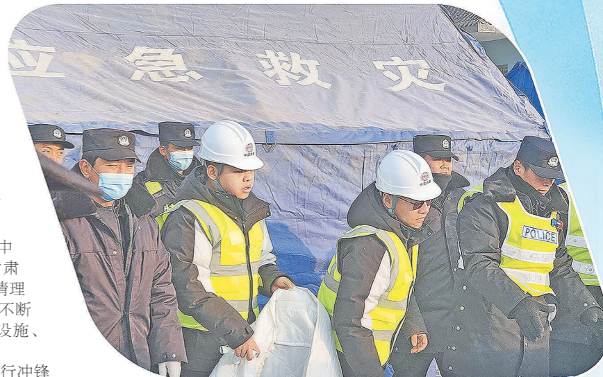
中铁二十一局在积石山地震发生后,协助搭建应急救援帐篷。

“中国铁建带来的温暖,是穿过寒夜的光。”逆行冲锋的铁建人身上,仿佛释放着粒粒“微光”,集结汇聚成一捧燃烧的“火炬”,成为他们与人民群众的共同守望。