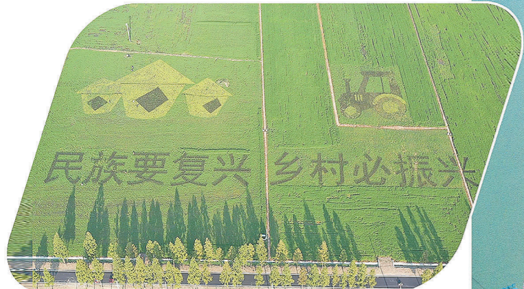
中铁二十三局安徽阜南县田集镇乡村振兴项目。