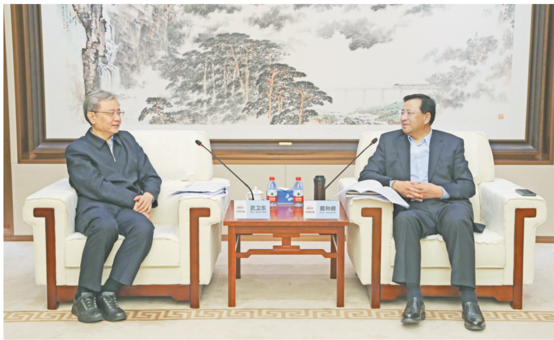
图为1月16日,戴和根与河北省常委、唐山市委书记武卫东会谈。

戴和根对唐山市委、市政府长期以来给予中国铁建的关心支持表示感谢,并介绍了中国铁建在唐业务开展情况。他表示,唐山市地理位置和资源优势突出,发展前景广阔,与中国铁建有着深厚的历史渊源和良好合作基础。作为特大型综合建设集团,中国铁建愿充分发挥全产业链优势,进一步与唐山紧密对接,深入落实双方战略合作框架协议,聚焦交通基础设施、城市更新及新建、新兴业务等领域深化务实合作,创新合作模式,深度参与唐山市发