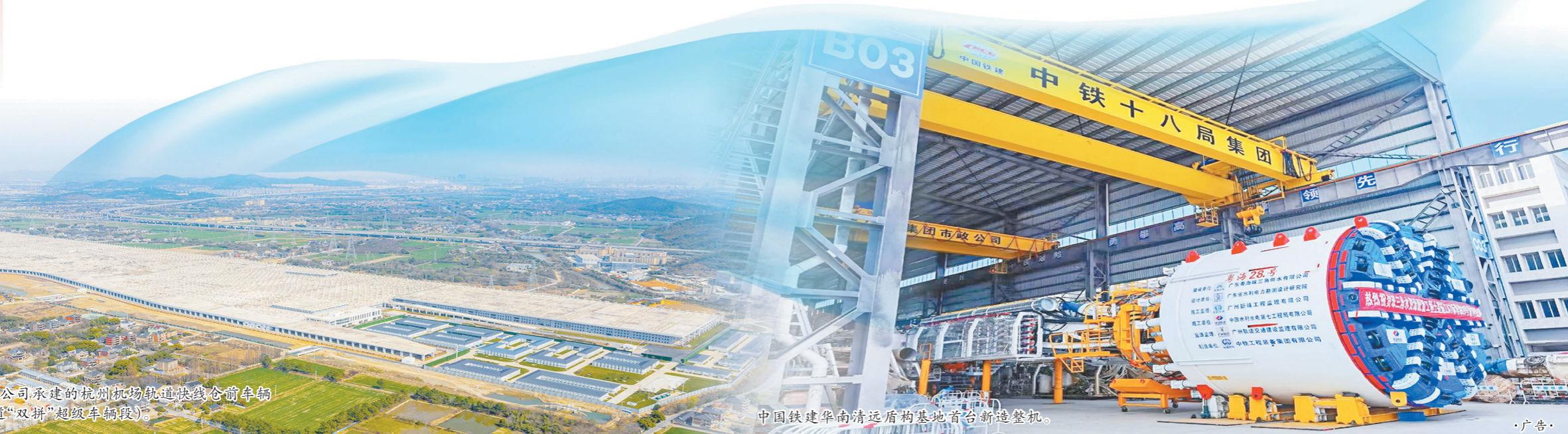
中铁十八局市政公司承建的杭州机场轨道快线仓前车辆基地(国内罕见的轨道“双拼”超级车辆段)。