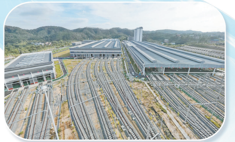
中铁十八局市政公司承建的南宁地铁5号线那洪车辆基地(广西首个无人驾驶地铁车辆基地,2021年12月获广西建设工程优质结构奖)。

聚焦轨道交通全产业链建设,中铁十八局市政公司于2021年建成“中国铁建华南清远盾构基地”。该基地集专业施工、技术研发、设备维保再制造、材料生产、人才培养于一体,运营以来已陆续为大湾区轨交市场提供50余台盾构机的维保、改造、再制造、新机组装、整机联调等服务,累计完成工业产值近2亿元,具备同时管理18台大盾构掘进能力,于2021年11月获评“全国质量信得过班组”,2022年3月获得“天津市第二十八届企业管理现代化创新成果一等奖”,2022年12月获得“天津市设备规范化管理规范班组”荣誉称号。该公司着力打造华南地区产业链最完善的盾构产业“一站式”服务基地。目前,盾构二期基地正在如火如荼地建设中。