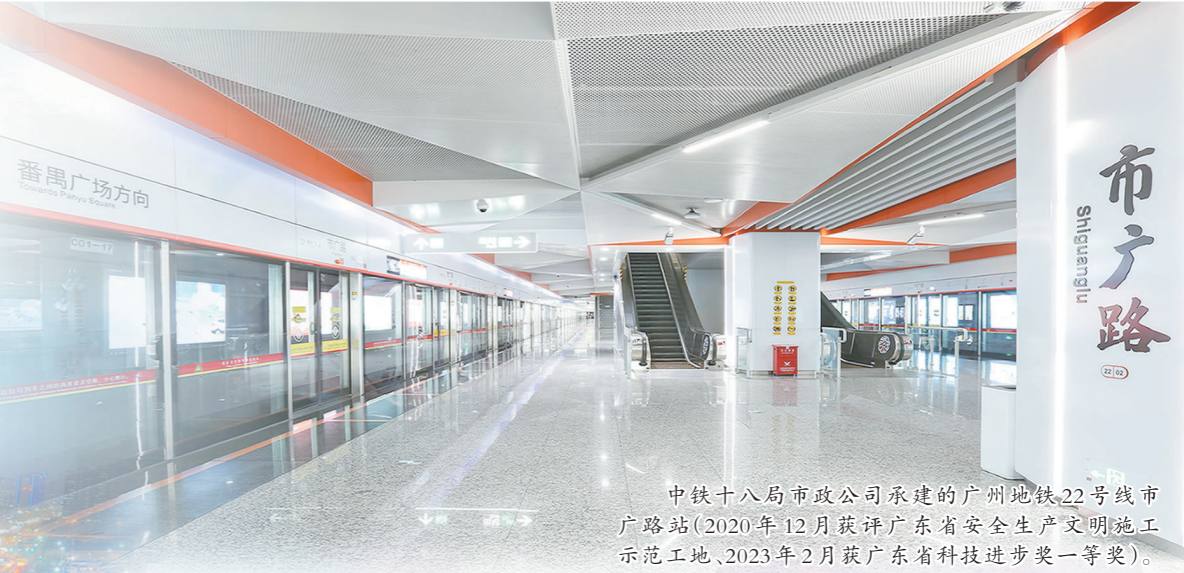
中铁十八局市政公司承建的广州地铁22号线市广路站(2020年12月获评广东省安全生产文明施工示范工地,2023年2月获广东省科技进步奖一等奖)。