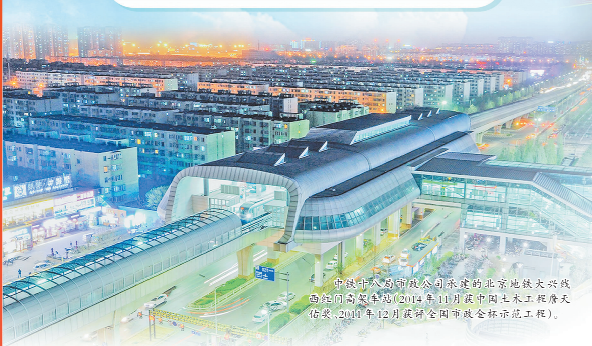
中铁十八局市政公司承建的北京地铁大兴线西红门高架车站(2014年11月获中国土木工程詹天佑奖,2016年12月获评全国市政金杯示范工程)。

近年来,中铁十八局市政公司坚持“市政为主、城市轨道交通为专”发展定位,紧紧围绕“做专做优做强”发展目标,着力提升发展规模 and 经济效益,已实现从“触底反弹”到“弯道超车”再到“发展跨越”的“三级跳”,成为中铁十八局轨道交通领域的“旗舰队”,专业化发展迎来量质齐飞新篇章。