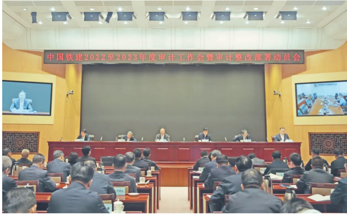
图为12月8日上午,中国铁建2022至2023年度审计工作会暨审计整改部署动员会现场。

就进一步推动审计工作高质量发展,会议强调,要进一步提高政治站位,深刻认识新时代审计工作的重要意义,正确理解新时代审计监督要集中统一、全面覆盖、权威高效的新要求,更好发挥审计监督作用;要进一步强化“大监督”工作,持续深化监督体系建设,健全完善“大监督”运行机制,明确监督主体,压实监督责任;