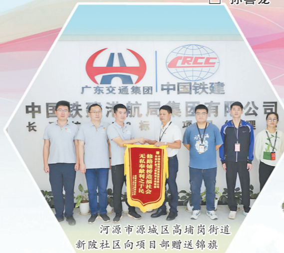
河源市源城区高埔岗街道新陂社区向项目部赠送锦旗

中国铁建港航局长深高速扩建T3标项目贯彻新发展理念,按照业主单位提出的“绿色低碳、匠心筑造、数字智能、和谐平安”建设理念,高标准推进项目建设,擦亮“中国铁建”金字招牌。