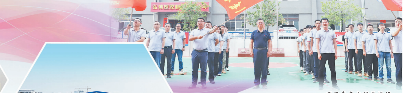
项目青年文明号授牌