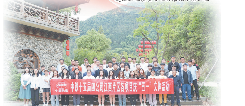
江西片区各项目部“五一”文体活动合影

连心小区获评“2022年度江西省建筑施工安全生产标准化示范观摩工地”“2022年度江西省建筑工程质量管理标准化示范工程”