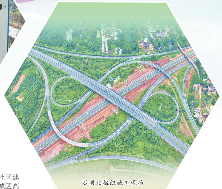
石坝北枢纽施工现场