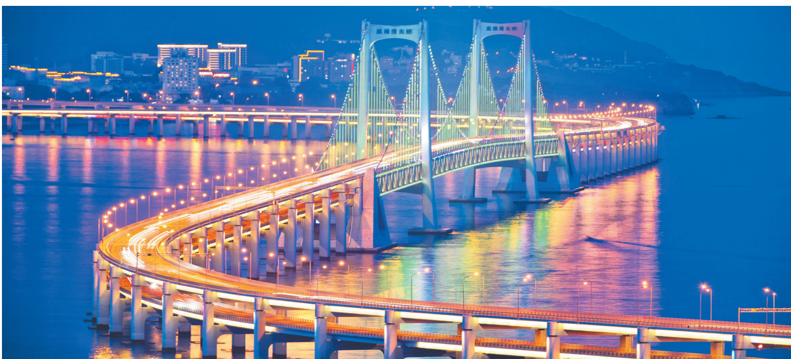
星海湾丝带 作者单位: 中铁二十二局四公司 张帅摄

赣深高铁的通车将为沿线城市、人民带去繁荣与希望,而建设者的故事不会就此完结,他们将带着建设赣深的珍贵记忆,继续大步前行…… 作者单位: 中铁二十五局三公司