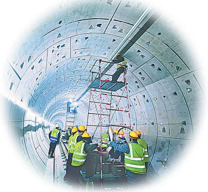
图为洛阳地铁接触网汇流排安装作业。

这些首创保障了各项目在节点工期内完工,同时,也为该公司抢占轨道交通建设制高点积蓄着力量。