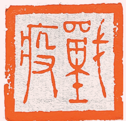
战疫（篆刻） 金安民 作 作者单位：中铁二十一局四公司