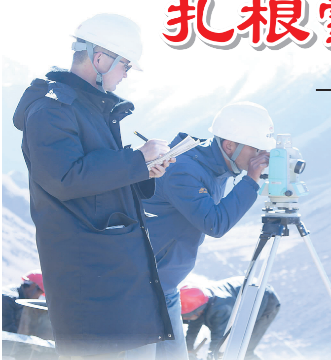
金桥水电站110千伏线路新建工程数据测量

自2015年首次进入西藏市场以来,该公司坚持以干好在建促发展,以优质品牌 and 良好信誉赢得市场,在当地树立了良好的企业形象。六年来,他们从单一的铁路迁改工程逐步拓展到输变电、铁路公网、房建等多个领域,实现了在西藏市场的滚动发展。