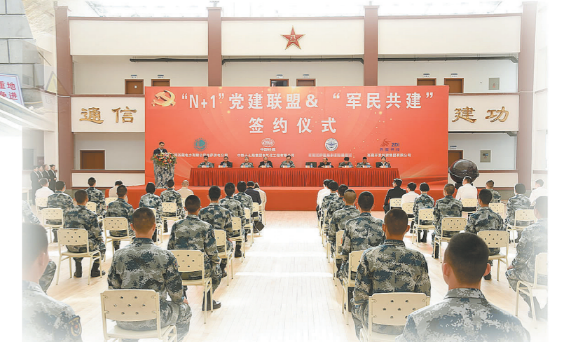
与驻藏部队、建设单位及其他企业共同开展党建联盟活动