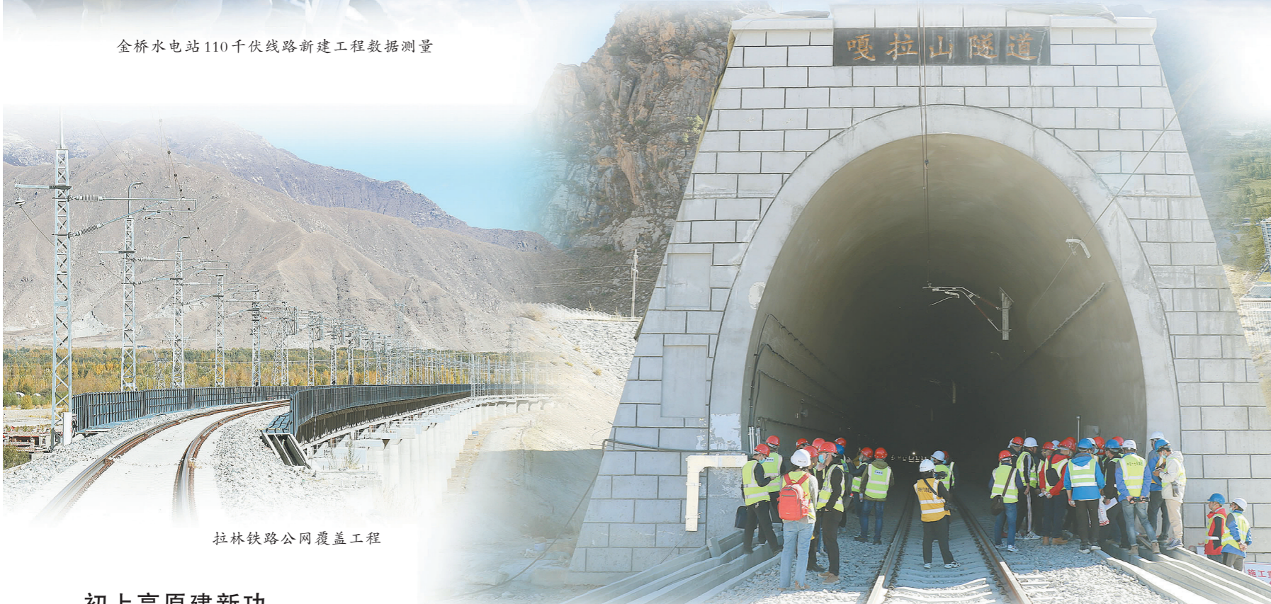
拉林铁路公网覆盖工程首站定标