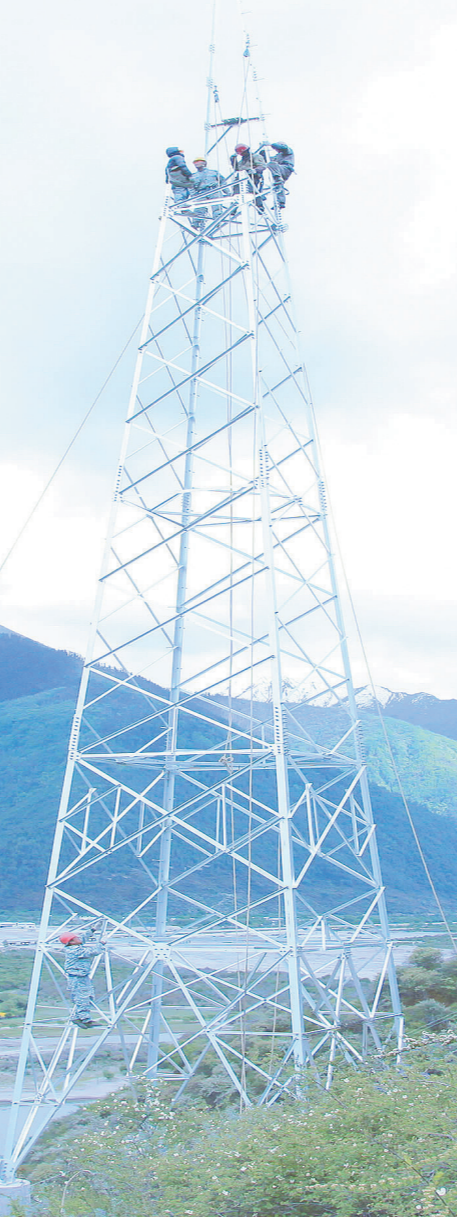
拉林铁路两电一通迁改工程