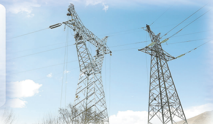
拉林铁路110千伏贡泽线迁改工程放线施工