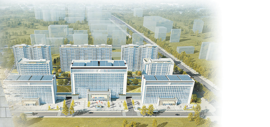
西藏开投能源基地项目