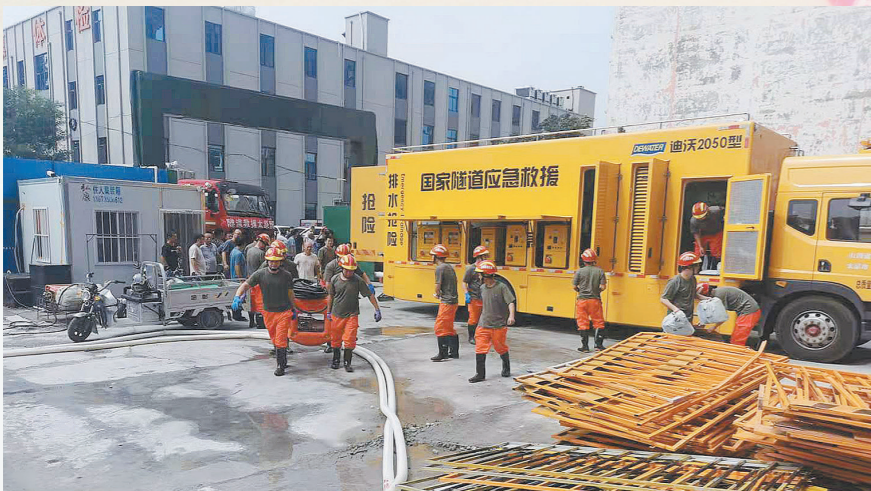
7月24日至30日,国家隧道应急救援中铁十七局太原队在河南新乡参与抢险排涝。投入救援人员25人,抢修设备21台套,累计完成排水130000立方。目前,该队队员仍奋战在一线。图为抢险救援队正在为高盛福润城在建工地排涝。