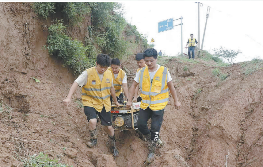
7月21日至29日,中国铁建电气化局在郑州局管内陇海铁路、新乡高铁站、卫辉市等地点累计抢修设备122台,敷设光电缆12.5公里,排除在建工地险情11处,参与大型公建基础设施抢险37处、参与居民小区排水等救灾4个。图为抢险救援组穿过受损道路,沿铁路线徒步四公里,携带发电机赶往抢险现场。