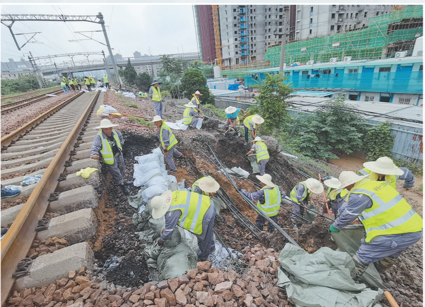
7月21日至30日,中铁十九局在郑州局管内陇海铁路、新乡高铁站、卫辉市等地点参与救援抢险,累计投入救援人员540余人,抢险设备60台,敷设光电缆16公里,抢修线路18公里,排除既有线路、在建工地险情108处,救出受灾群众330余人,运送救援物资和生活物资两万余件。图为抢险救援队正在抢修陇海铁路边坡。