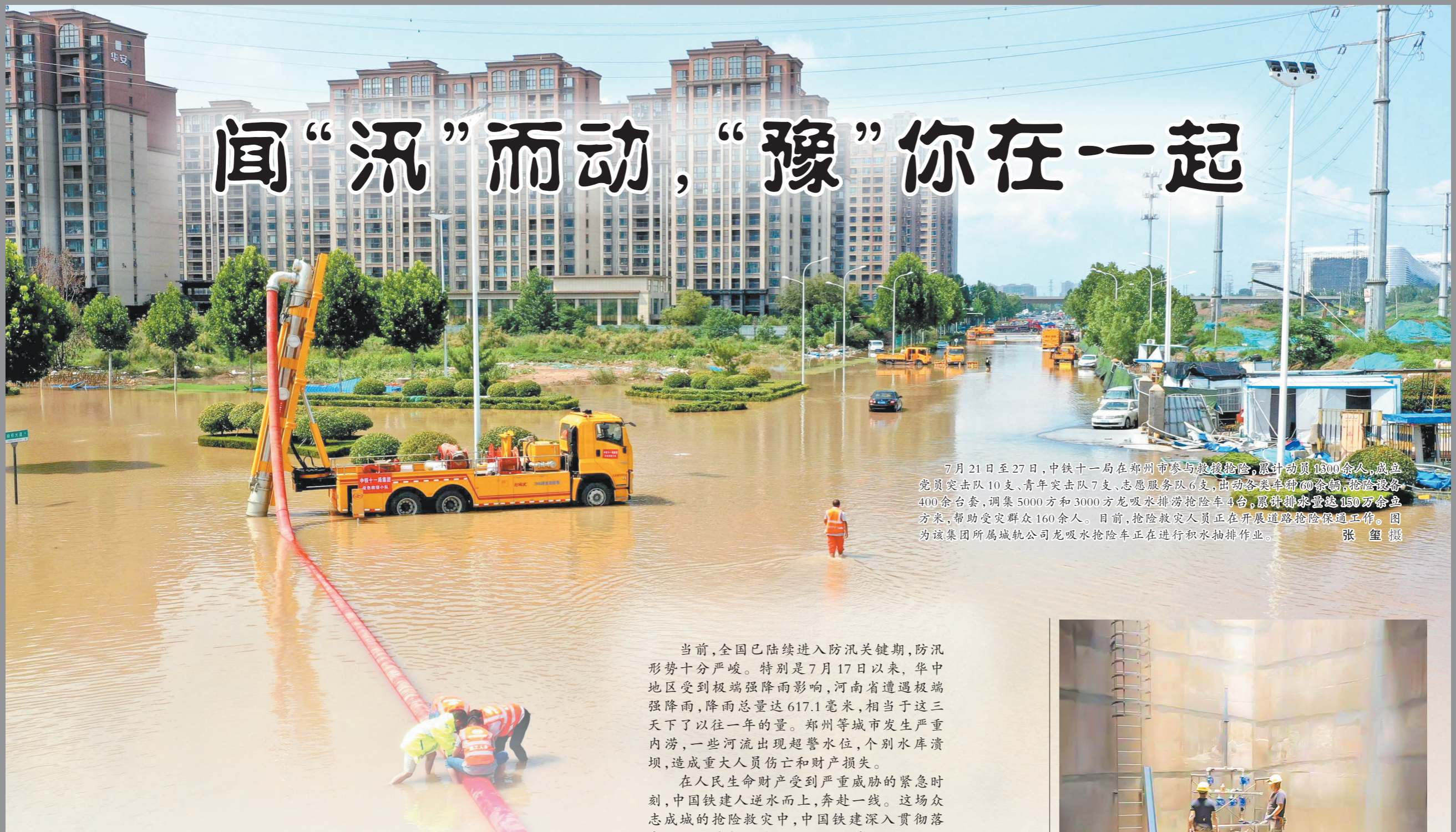
7月21日至27日,中铁十一局在郑州市参与救援抢险,累计动员1500余人,成立党员突击队10支、青年突击队7支、志愿服务队6支,出动各类车辆60余辆,抢险设备400余台套,调集5000方和3000方龙吸水排涝抢险车4台,累计排水量达150万余立方米,帮助受灾群众160余人。目前,抢险救灾人员正在开展道路抢险保通工作。图为该集团所属城航公司龙吸水抢险车正在进行积水抽排作业。

当前,全国已陆续进入防汛关键期,防汛形势十分严峻。特别是7月17日以来,华中地区受到极端强降雨影响,河南省遭遇极端强降雨,降雨总量达617.1毫米,相当于这三天下了以往一年的量。郑州等城市发生严重内涝,一些河流出现超警水位,个别水库溃坝,造成重大人员伤亡和财产损失。