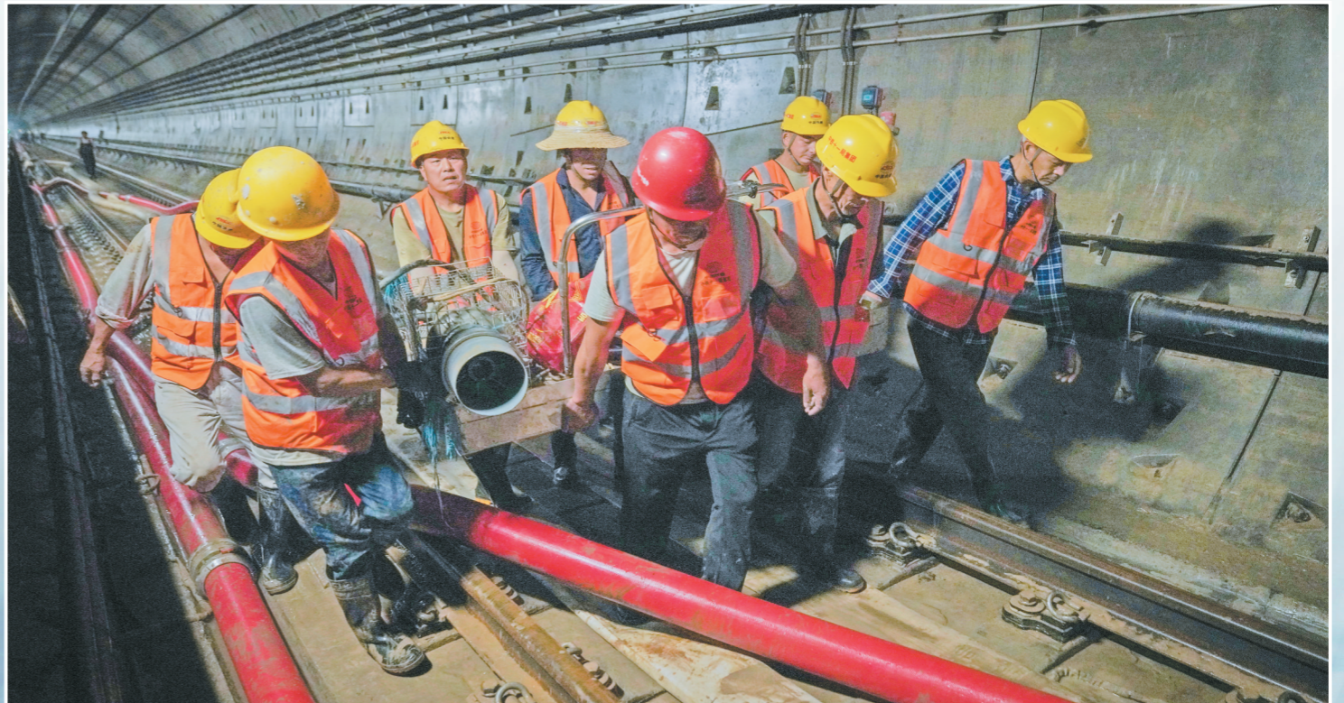
7月25日,中铁十一局六公司郑州港区北车辆段项目调派120名建设者,于早上7点抵达积水接近4万余方的郑州地铁5号线黄河路站区间隧道。经过了3天不眠不休的排污抢险,在7月29日凌晨将污水全部抢险完毕,为下一阶段电力抢修打通了快车道。图为排水抢险作业现场。