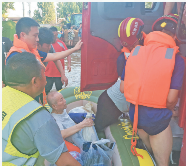
7月24日至29日,中铁二十三局四公司兰原项目部救援队赶赴新乡牧野、凤泉等受灾一线,共计转移和救援被困人员5080余人,转运急用生活物资430余吨。图为中铁二十三局救援队员转移受灾被困群众。