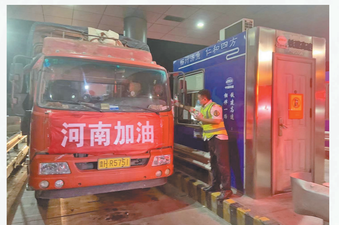
7月21日至30日,铁建投所辖高速公路各路段免费通行抗洪抢险车400余辆,累计免收通行费5万余元,设置援豫保畅专属绿色通道30余条。图为收费工作人员向援豫车辆司机送上矿泉水食物等慰问品。