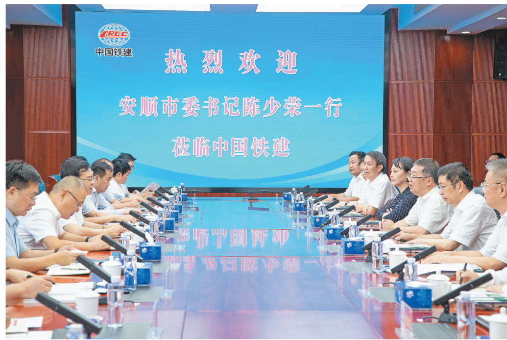
图为7月22日,庄尚标会见安顺市委书记陈少荣。