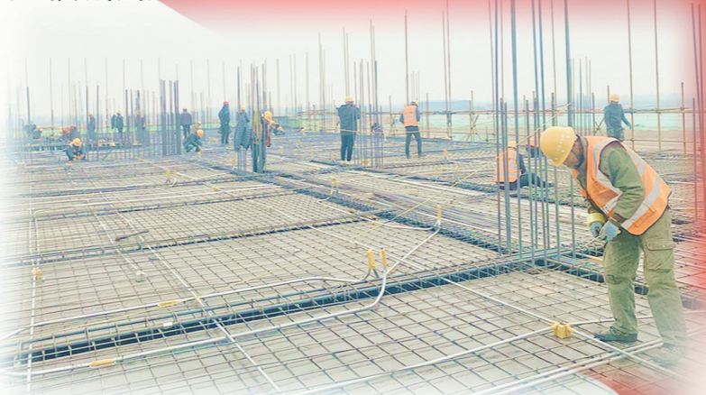
项目综合业务楼混凝土施工