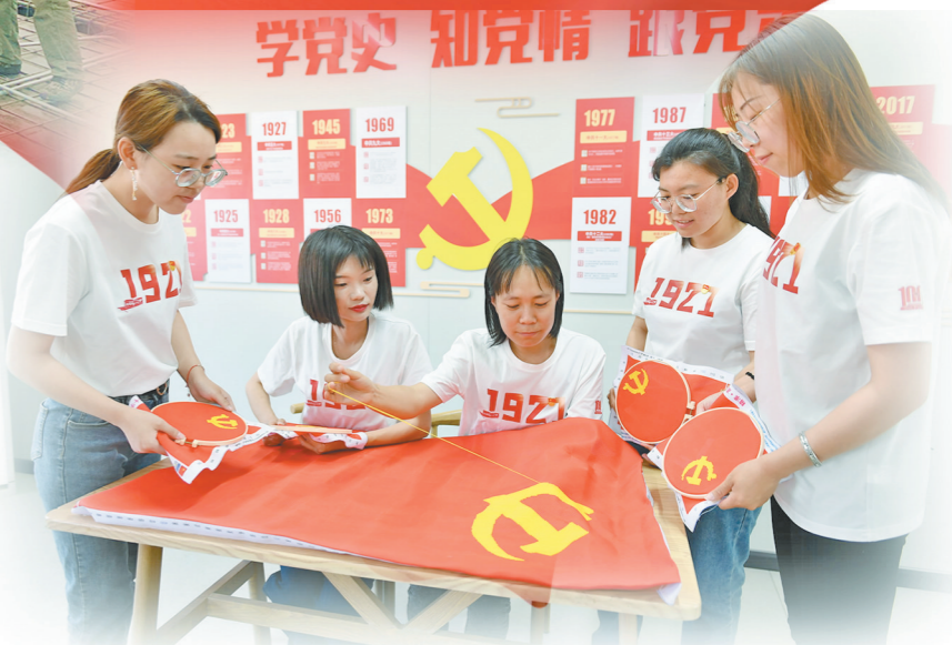
项目部女工手绣党旗献礼建党百年

一年来,这支平均年龄仅为24岁的青年团队总结形成了“一种房建施工用人型梯、屋顶排水阀门组件”等8项技术成果,并获国家专利授权,“降低市政排水检查井渗水率”获得省级工法,目前正在申报国家奖项。他们还成立了QC小组,针对工程特点,选择课题攻关。