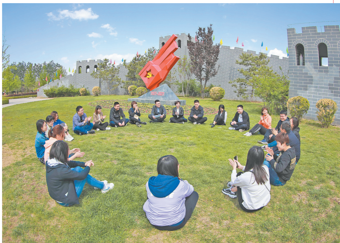
日前,中铁十六局一公司团委组织团员青年来到爱国主义教育基地——焦作户部道遗址纪念馆重温历史,缅怀先烈。图为参观结束后,团员青年围坐在一起,分享学习体会。

即中华人民共和国中央人民政府成立典礼。1949年9月21日至30日,中国人民政治协商会议第一届全体会议在北平举行。