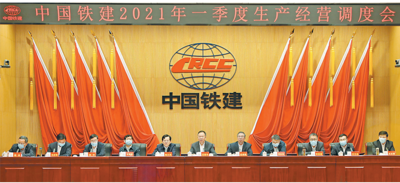
图为4月29日,中国铁建2021年一季度生产经营调度会主会场。

会议强调,生产经营是企业的中心工作,各单位各部门特别是各级领导干部,要切实扛起责任,确保各项要求落实到位。要坚持集约化发展,坚持围绕市场要素改革进行经营布局,坚持各级经营主责的定位不动摇,坚持以实绩为导向的考核标准,提升市场开拓品质;