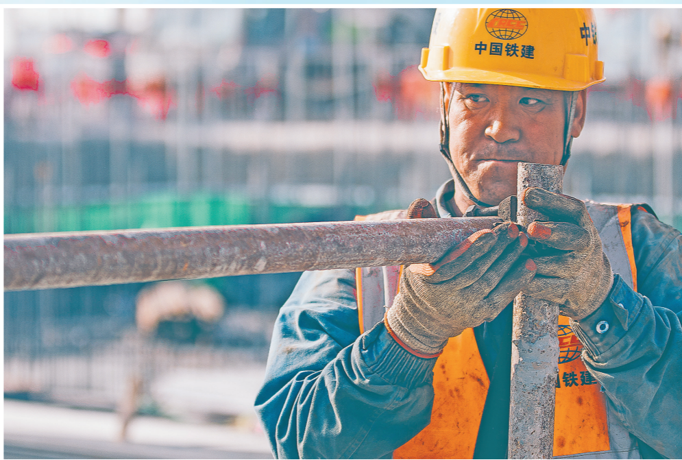
4月23日,在中铁建设雄安新区西片区安置房C3标段施工现场,架子工正在搭设临边防护。