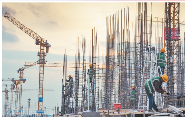
由中铁建设承建的雄安新区西片区安置房C3标段,总建筑面积约65.7万平方米。项目在“十四五”开局之年,率先完成首块车库底板浇筑,成为容西片区第一个出主楼正负零的项目。图为4月24日,施工人员进行主体结构施工。