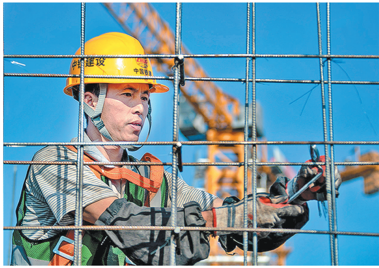
由中铁建设承建的雄安新区西片区安置房C3标段7-1地块目前已进入主体结构大干阶段,每天可绑扎钢筋800余吨,浇筑混凝土至少4000方。图为4月23日,施工人员进行钢筋绑扎作业。