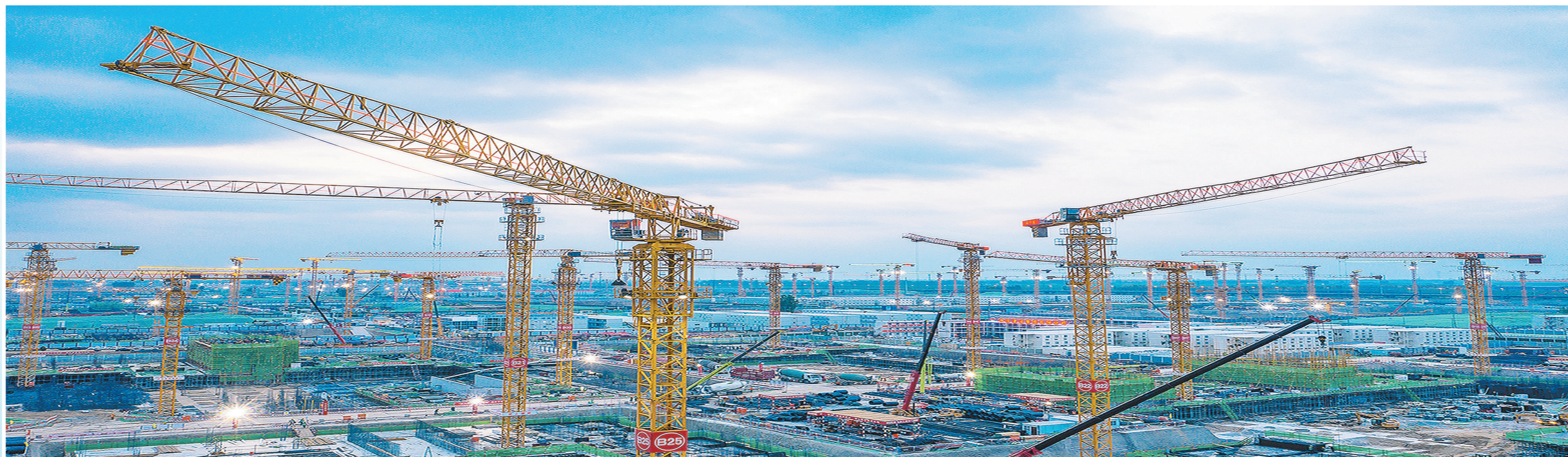
由中铁建设承建的雄安新区西片区安置房C3标段项目,是继容东片区D1组团、G组团G3标段项目之后,在雄安新区滚动承揽的又一大型民生工程。建成后助力容西片区打造以生活居住功能为主的宜居宜业综合城区、生态智能创新城区,服务搬迁安居。图为4月23日,塔吊林立的建设现场。吴凡 摄

作为中国铁建建领域的领军旗舰,中铁建设是最早一批进驻雄安新区的央企,从承担中国铁建在雄安合同额最大的容东片区安置房D1地块,到容东片区G组团G3标段接连创下首栋主体结构封顶和首个标段全面结构封顶两项“第一”。中铁建设在开局之年起好步,充分发挥专业优势,为“千年之城”贡献着铁建智慧和铁建力量,助力雄安腾飞。