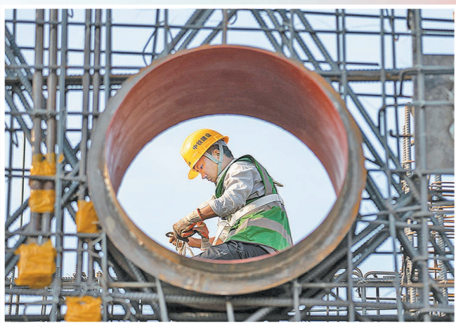
4月24日,雄安新区西片区安置房C3标段项目建设现场,中铁建设水电施工人员进行人防暖通预埋作业。