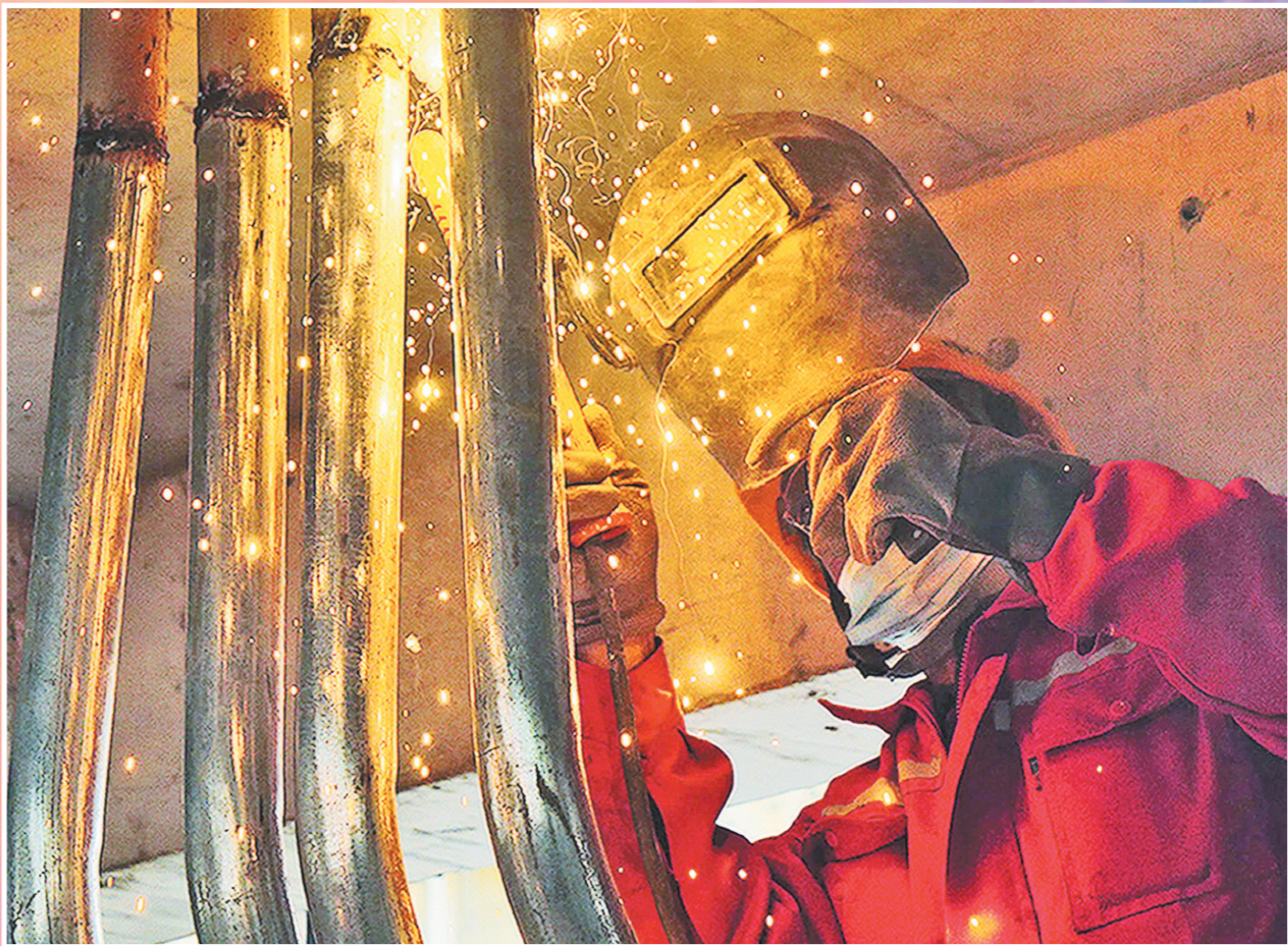
由中铁建设承建的雄安新区东片区D1组团安置房项目,总建筑面积约168.51万平方米,包含1所小学、2所幼儿园。项目共有管理人员450余人,高峰期施工人员达1.4万人。目前,166栋楼已完成二次结构砌筑施工,全面进入精装修阶段。图为4月24日,建设者正在进行管道焊接作业。哈斯达 摄