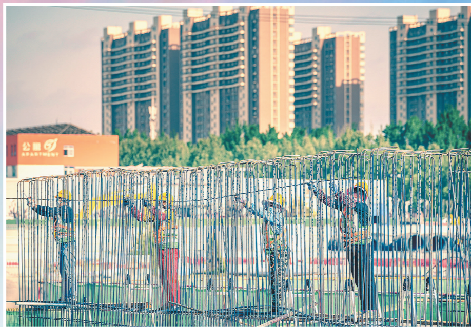
4月25日,在中铁建设雄安新区西片区安置房C3标段建设现场,四名施工人员进行车库外墙钢筋绑扎工作。