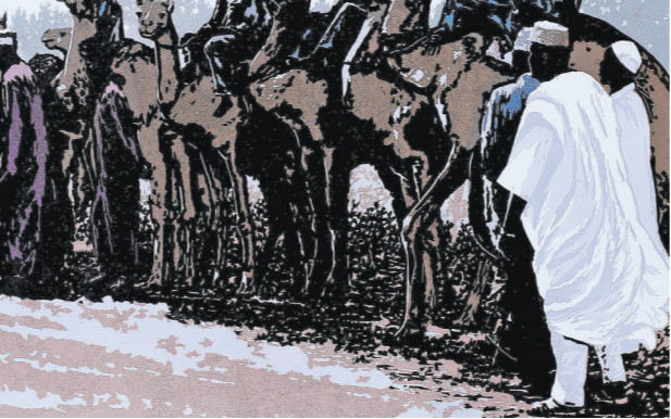
开工典礼(版画) 双道俊 作者单位:中铁二十局

第一期工程于1953年9月上旬展开至年底结束。9月29日,除需复旧的正桥两端线路与便线、便桥和管内内线路及已修复正桥的维护外,其余先后移交朝方路局负责;至10月底,龙津江、锦川、东瀚江、郭山川等正桥复旧和平元线179公里之半永久性便线、便桥工程结束并移交;11月21日西清川江桥复旧移交;12月15日大宁江桥复旧移交。这一期复旧工程共修复、改善、新建桥梁282座,延长1.55万多米;线路19处,延长6000余米;车站34处,延长1.53万多米;给水37处;隧道21