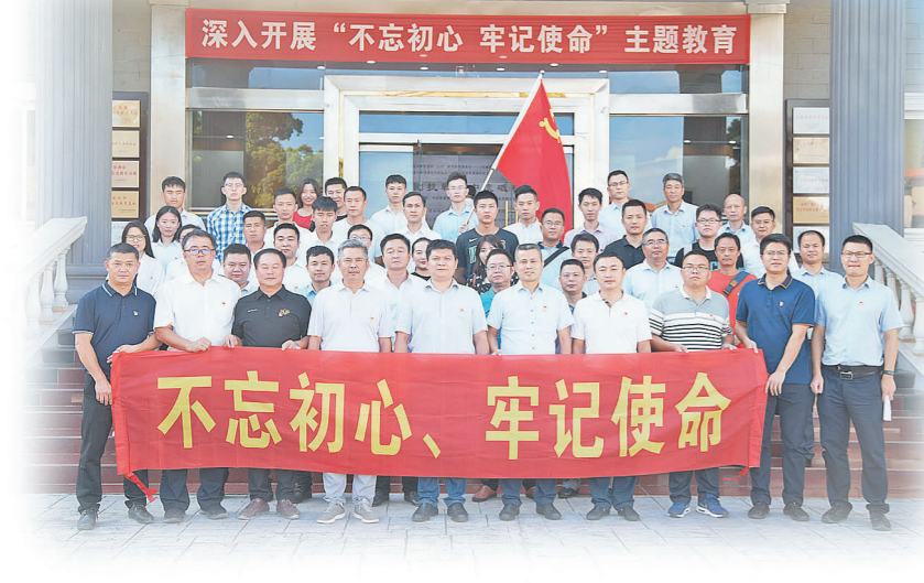
与深铁建设、大唐经纪、中国人寿三家单位党支部开展“不忘初心、牢记使命”主题教育联建活动