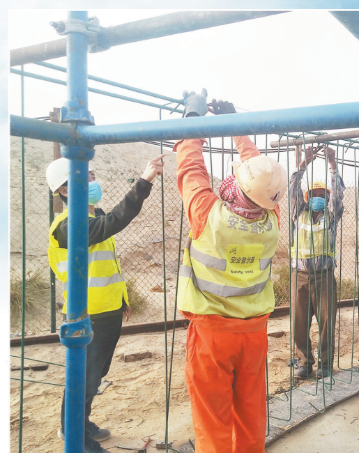
中铁十八局集团沙特公司朱拜尔TS-8高速公路项目在疫情期间，安全生产和疫情防控两手抓，顺利完成了该项目里程碑计划的节点任务。图为当地时间3月18日，施工人员进行S7桥预制拱片钢筋笼绑扎。