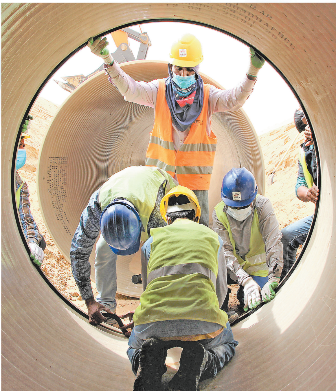
3月份以来，沙特阿拉伯为有效进行疫情防控，多个城市采取了宵禁措施。由中国铁建国际集团中东区域公司承建的沙特阿美萨勒曼国王能源城项目，也采取了相应的宵禁措施，保障职工安全。图为当地时间3月29日，工人在进行管道对接安装作业。