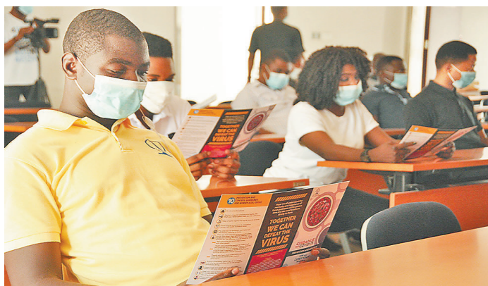
当地时间4月1日，中土尼日利亚有限公司开展新冠病毒肺炎疫情防控知识讲座，同时为当地员工发放防疫宣传手册。图为讲座中当地员工正在认真翻阅宣传手册。