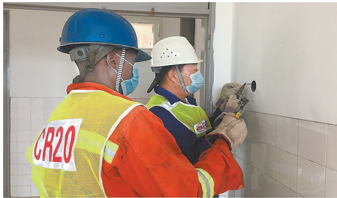
当地时间3月24日，中铁二十局集团参与建设的安哥拉万博省疫情防控隔离医院正式交付，标志着安哥拉版“小汤山”医院开始投入使用。这座医院总面积超300平方米，有40张床位。图为施工人员正在安装开关。 宋永钊 文