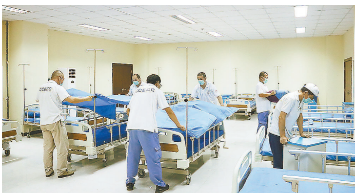
当地时间4月7日，中土尼日利亚有限公司积极配合当地政府，在首都阿布贾建设“阿布贾伊都地区方舱医院”。图为建设者正在进行医院设施布置。