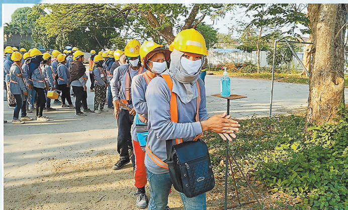
中铁十一局集团与泰国当地企业 Krung Thon 组成联合体承建的泰国复线铁路巴蓬至春蓬段项目，坚持防疫施工两手抓两手硬，严格做好日常消毒和防疫，强化营区疫情管控。图为当地时间3月23日，施工人员依次消毒进入施工现场。