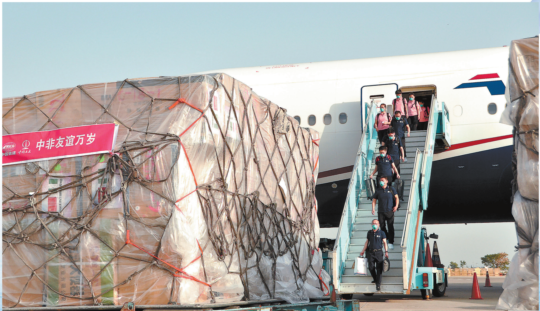
当地时间4月8日下午，经历了16个小时的飞行后，中国铁建赴尼日利亚防疫工作组顺利抵达尼日利亚阿布贾国际机场，部分防疫物资已卸下。图为工作组队员正在走下舷梯。