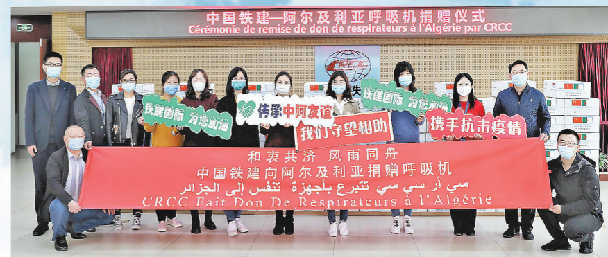
4月1日，中国铁建向阿尔及利亚捐赠呼吸机仪式在铁建国际举行。中国铁建党委书记、董事长陈奋健代表中国铁建将捐赠的100台呼吸机递交给阿尔及利亚驻华大使艾哈桑·布哈利法，助力该国早日战胜新冠肺炎疫情。图为中国铁建员工为阿尔及利亚抗疫加油。

目前，中国铁建全力保障全系统内广大海外员工的生命安全，确保了海外项目疫情防控有序，海外生产经营稳中有进，持续推进“海外优先”战略落地见效。这次疫情让人们再次认识到，唯有携手应对挑战，才能实现共生共荣。