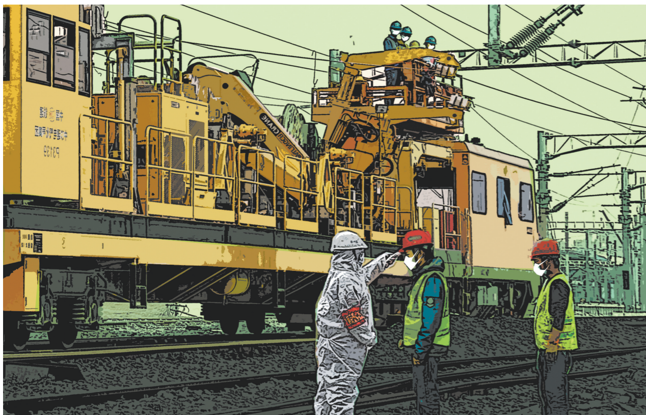
防疫不放松,复工不懈怠 (版画)