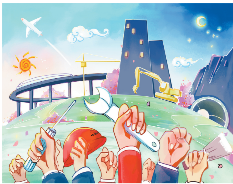
复工的喜悦 (水彩画)