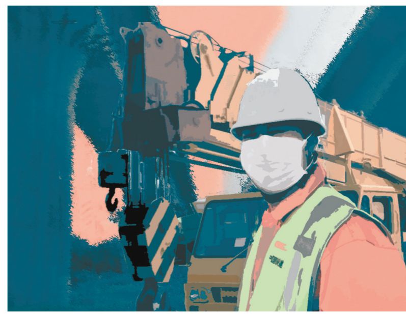
用我们的方式为你加油 (版画)