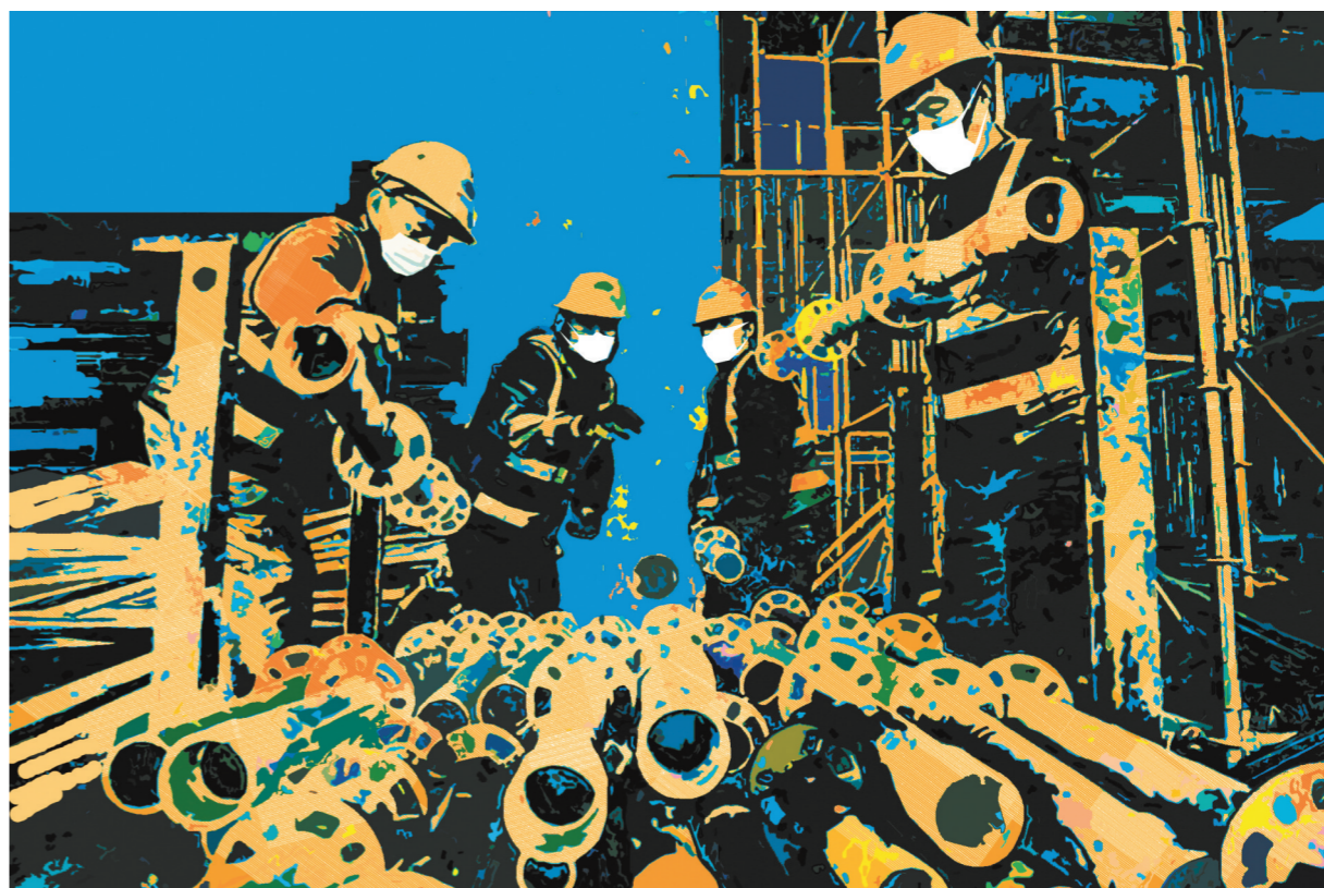
多彩的复工奏鸣曲 (版画)