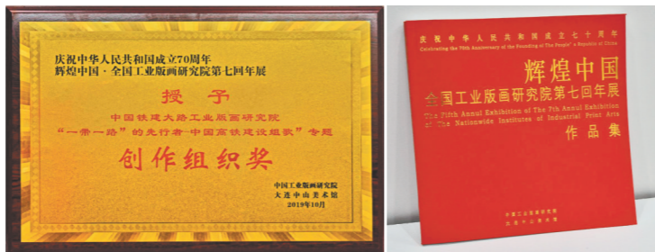
图为中国高铁专题创作组织奖奖牌和作品集。