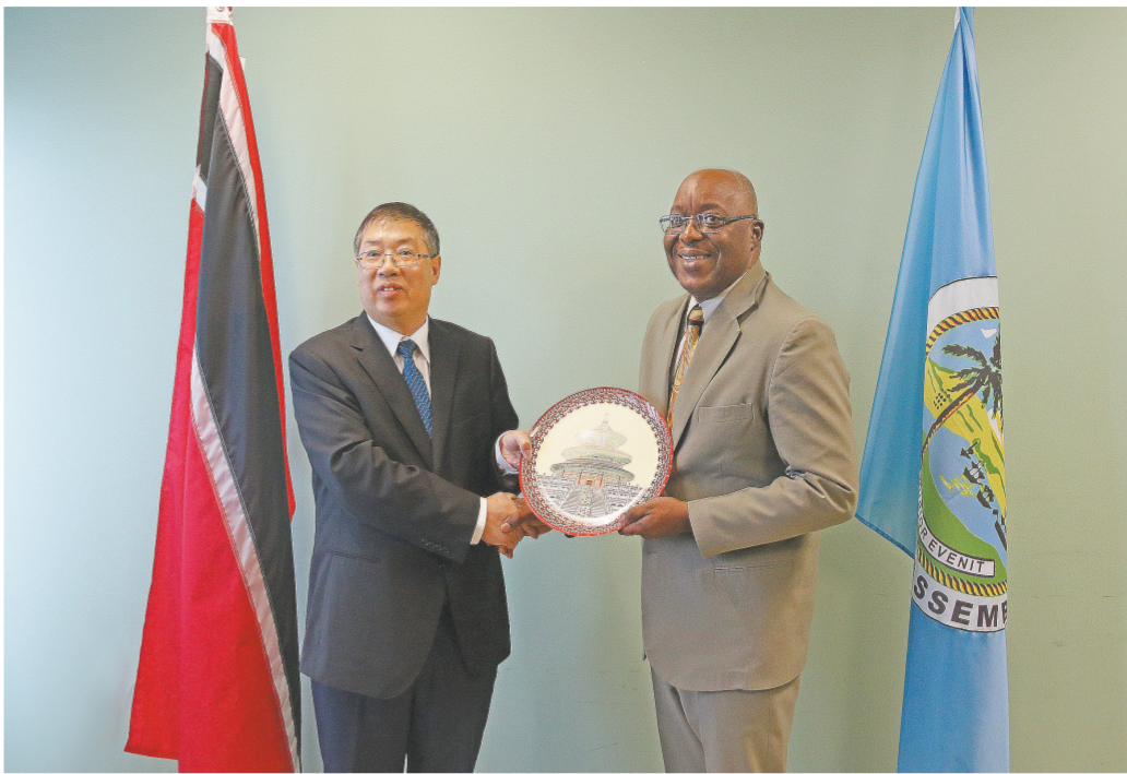
图为庄尚标向多巴哥议会会议长凯文·查尔斯赠送纪念品。