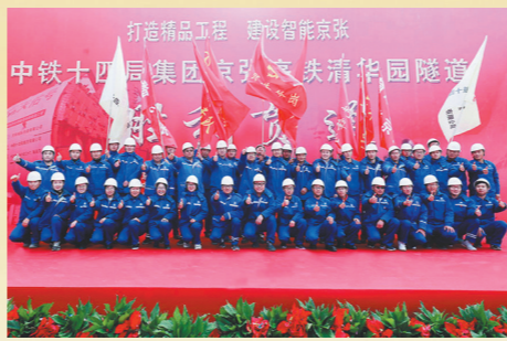
中铁十四局集团京张高铁清华园隧道项目团队

全长13公里的拉林铁路巴玉隧道,是举世瞩目的川藏铁路重难点控制性工程,存在世界性岩爆难题。中铁十二局集团“最强岩爆”攻坚团队不惧艰险、迎难而上,在海拔3400米的雪域高原,头戴钢盔、身穿防护服,与岩爆“硬刚”。4年多来,他们扎根高原,在“枪林弹雨”中不断摸索,研究岩爆发生规律,科学攻克破解岩爆难题,月掘进由原先的几十米提升至160米,并始终保持安全质量良好态势,被拉林铁路指挥部评为全线唯一A+级单位。2019年11月2日,巴玉隧道成功贯通,其事迹先后被中央电视台、工人日报、湖南卫视等多家媒体报道,在全社会产生了极大反响。