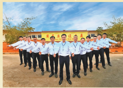
中铁二十局集团安哥拉项目经理部

中铁十四局集团承建的清华园隧道工程,是北京冬奥会重要配套设施——京张高铁的重点控制性工程,全长6020米,盾构机开挖直径12.64米,是华北地区直径最大的单洞双线高铁盾构隧道。该团队实现大直径盾构机安全平稳长距离侧穿正在运营的北京地铁13号线,下穿北四环、北三环等7条城市主干道和88条重要市政管线,达到单日掘进22米、单月掘进328米,创造北京地区大直径盾构掘进纪录,提前一个月全线贯通,中国铁路集团有限公司多次发电祝贺。荣获中华全国铁路总工会“火车头奖杯”“中央企业青年文明号”等称号。