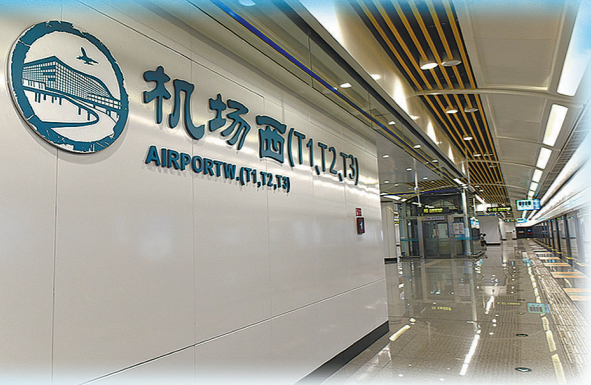
中铁十七局承建的机场西站

项目路基段穿越了秦宫站和秦汉新城站。他们在路基填筑过程中引进了填料振动搅拌及新型路基智能连续压实系统,通过控制碾压厚度、碾压遍数以及压路机速度等施工参数对路基压实度进行实时监控,有效提高了路基工程的施