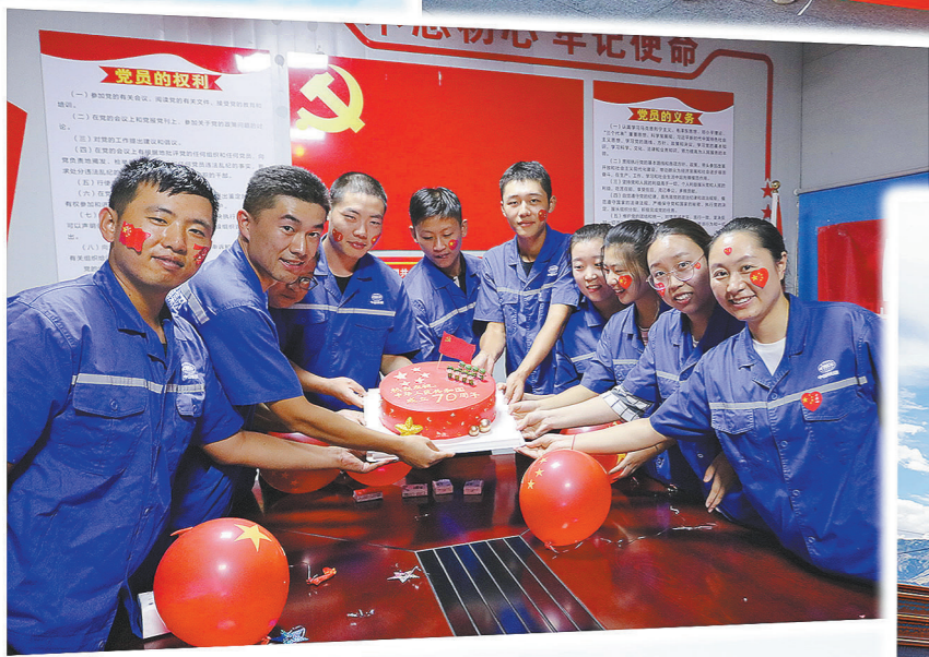
►为迎接新中国成立70周年,中铁十一局三公司拉林项目部开展了“我与国旗合影”系列活动,通过与国旗合影的方式将迎接新中国成立70周年华诞的喜悦带到施工一线的每一个角落。