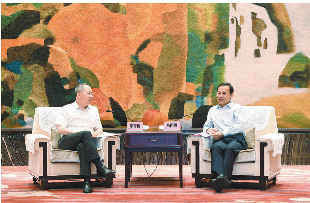
图为陈奋健与湖北省委副书记、武汉市委书记马国强亲切交谈。