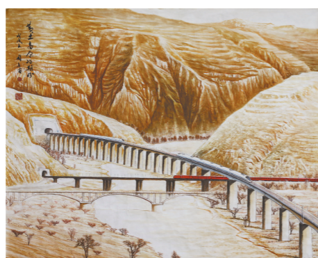
黄土高原的期盼 (国画) 刘国占

据悉,此次画展是“刘国占绘画艺术工作室”自成立以来首次在施工一线展出,受到了一线建设者好评。同时,此画展将陆续到四公司所建30多个重难点工程项目巡回展出,丰富一线职工的文化生活。