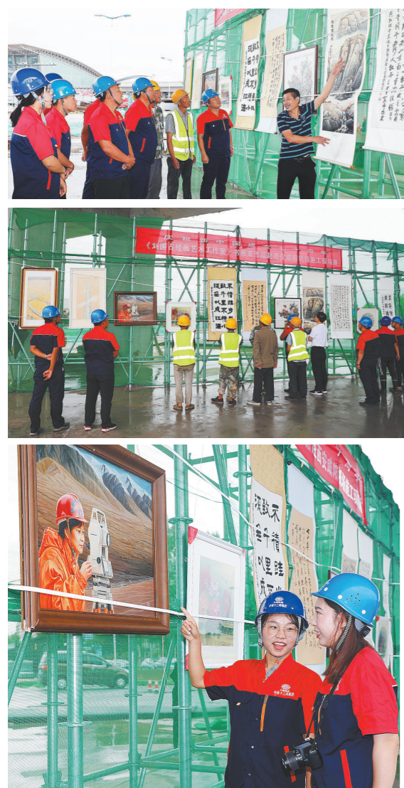
咸阳机场道路改造B匝道桥项目部职工兴致勃勃地参观施工一线画展。