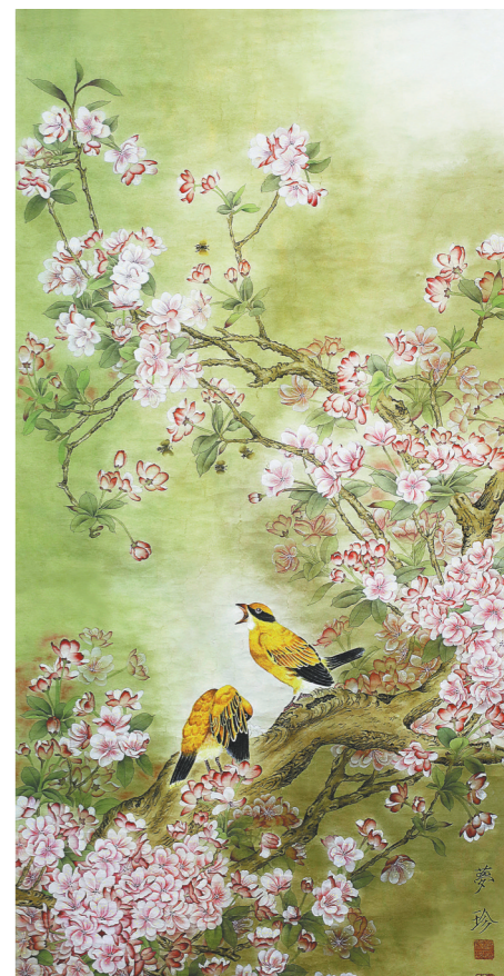
三月繁花 (国画) 董梦珍