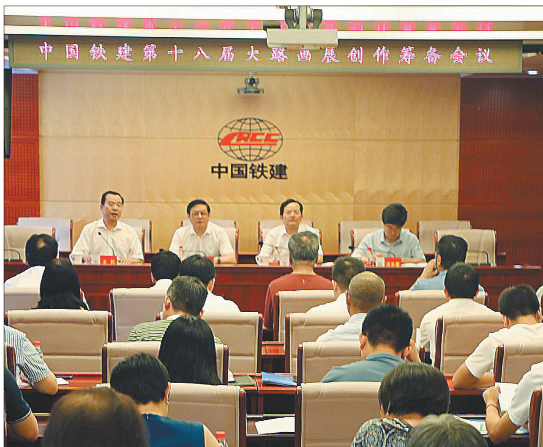
8月2日上午,“中国铁建第十八届大路画展创作筹备会议”召开全体会议。

会议表决通过了大路美协第十八届组织机构和大路美术研究院专业机构,对大路画展策划草案、实施方案和重点作品题材进行了深入研究。大路美术国画、油画、版画学会分组讨论、酝酿了重点作品的创作构思。大路美术家协会在综合大家意见的基础上,制定了展务推进计划。大路美术工作者们立足时代特征、铁建特色、个人特长,结合自己的工作和生活阅历,畅谈了创作作品的构思。大家激情高涨,对创作精品、办好画展充满了信心,表示将以最好的作品,共同形成记录中国铁建辉煌征程、反映“一带一路”建设伟大历史进程的辉煌画卷,努力服务人民,鼓舞员工。