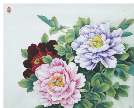
欣欣向荣 (国画) 杨丽书