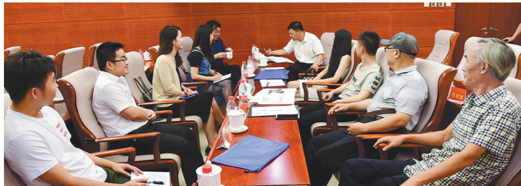
8月2日,参加会议的大路美协版画组画家们利用晚上时间进行分组讨论。