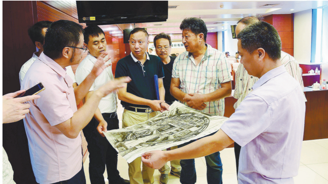
参加会议的大路国画和油画组画家们分组讨论创作方案。