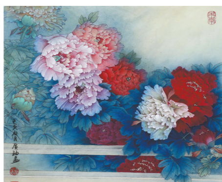
月色怡人 (国画) 杨广袖