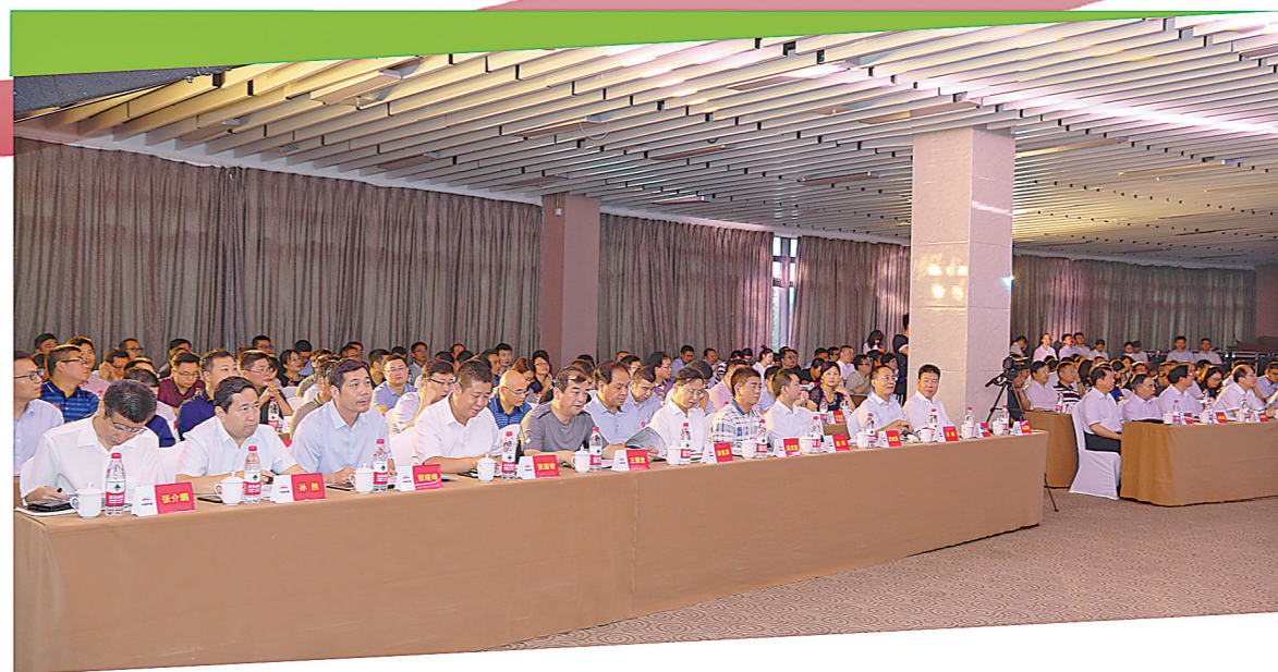
铁建商城2.0推介会现场