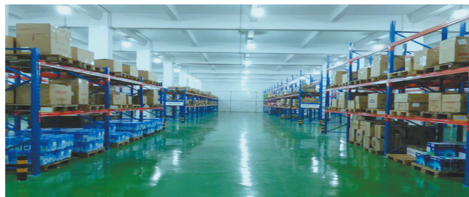
铁建商城线下华南店仓储服务

铁建商城遵循国家《电子招标投标办法》以及《电子招标投标系统技术规范》要求,建立了覆盖全网络各类交易项目的电子招标、投标、开标、评标及行政监管、信息发布等子系统。招投标系统1.0通过依托网络和信息技术,提供即时、高效、便捷、安全的信息化服务,并于2018年12月获得了国家电子招标投标系统交易平台三星认证资质。