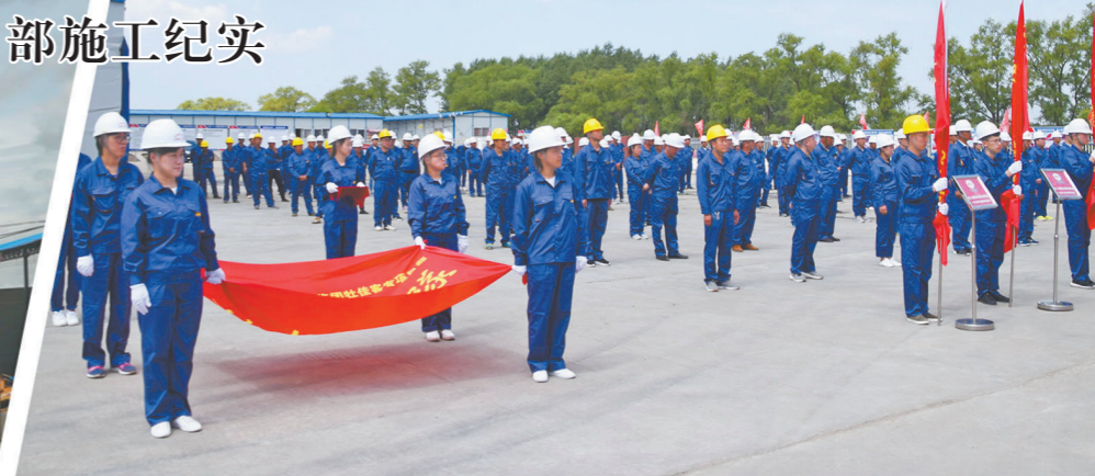
项目部开展“劳动竞赛暨青年突击队竞赛”誓师动员会。