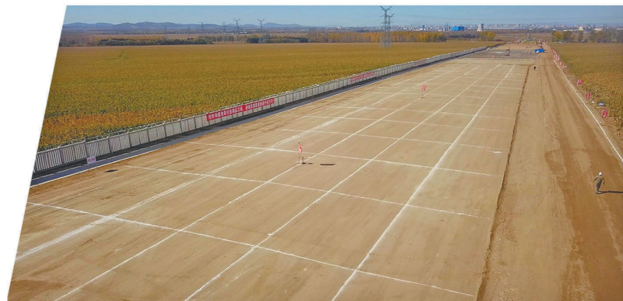
全线首件路基示范段。

该项目部先后获得中铁二十二局“先进集体”“劳动竞赛创新杯金奖”,共青团佳木斯市前进区委员会“十佳青年文明号”等荣誉称号。