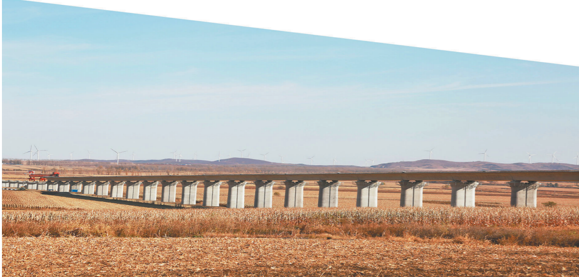
全面进入架梁施工阶段的牡佳客专跨佳富2号特大桥。

如今,林立的墩身、飞翔的箱梁,构筑起一幅壮美的画卷,建设中的牡佳客专犹如一条龙,舞动在三江大地上。