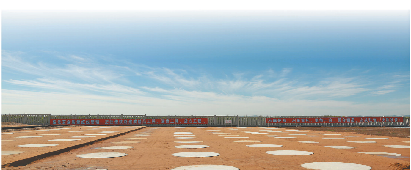
项目部在东北地区率先引进螺杆桩打桩系统。