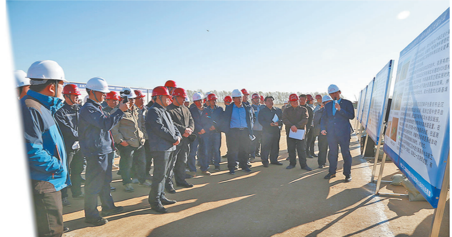
哈牡客专公司样板工程现场观摩会在哈建公司牡佳客专项目部顺利召开。

项目部党工委认真贯彻落实党的十九大精神,持续推进“两学一做”学习教育常态化、制度化,以生产经营为中心,积极开展各项活动,助推项目平稳发展。以“安全质量管控年暨施工生产百日会战”为契机,该项目部深入开展“党员先锋岗”“党员责任区”“青年突击队劳动竞赛”等特色活动,强化基层党组织战斗堡垒作用,充分发挥党员的先锋模范作用,迅速完成了该标段的第一根钻孔桩、第一个承台、第一