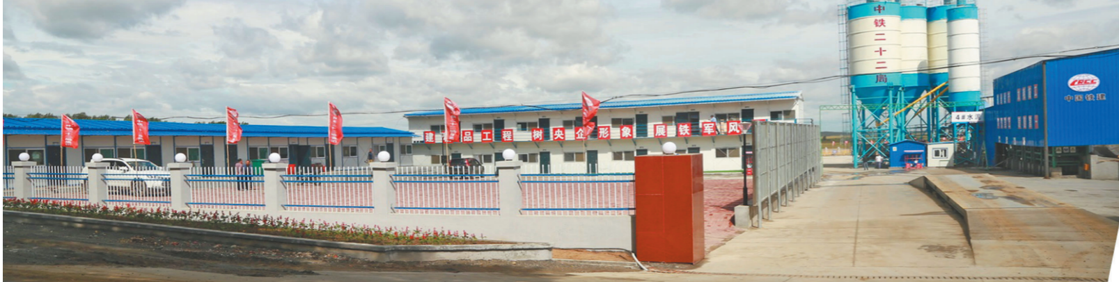
标准化级配碎石站。