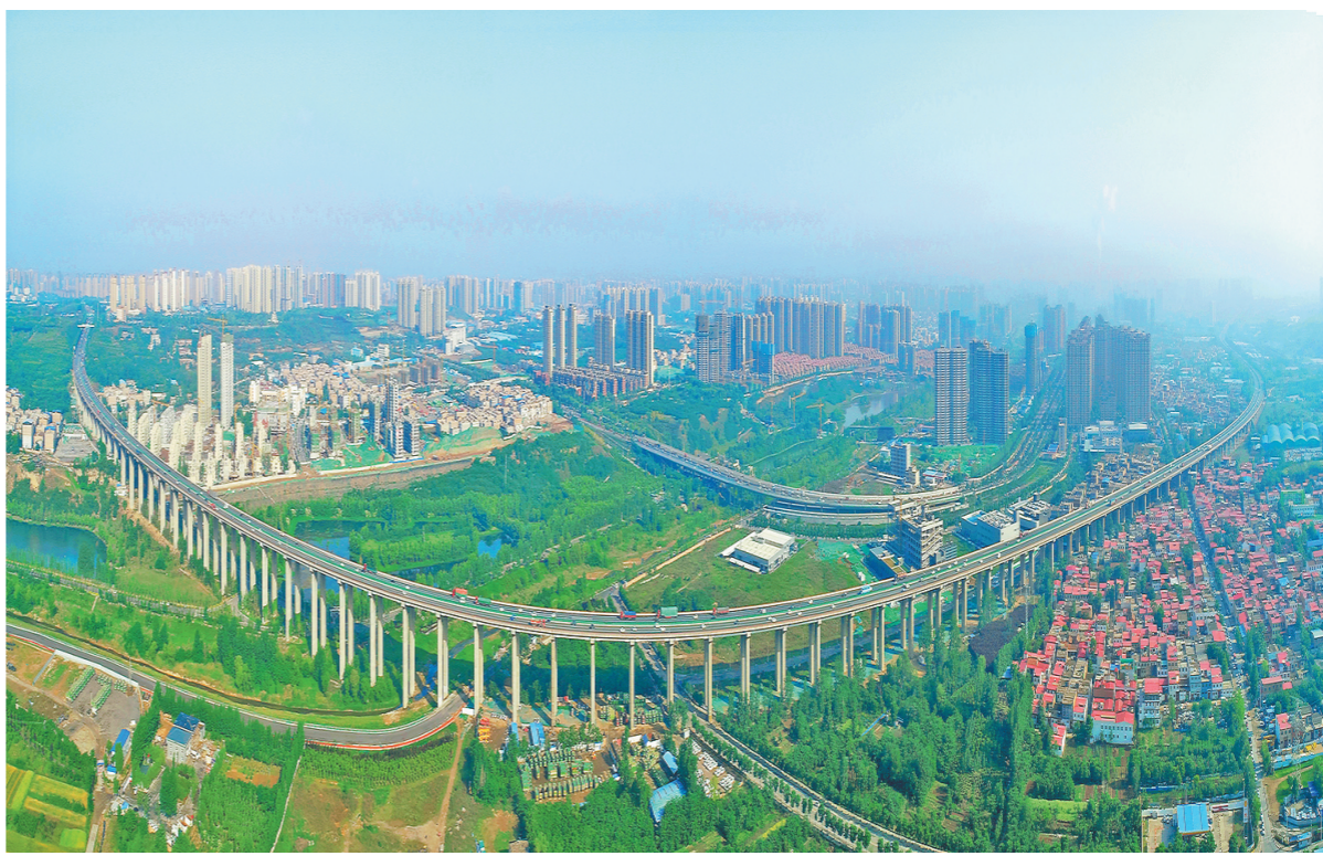
长桥无言 见证发展