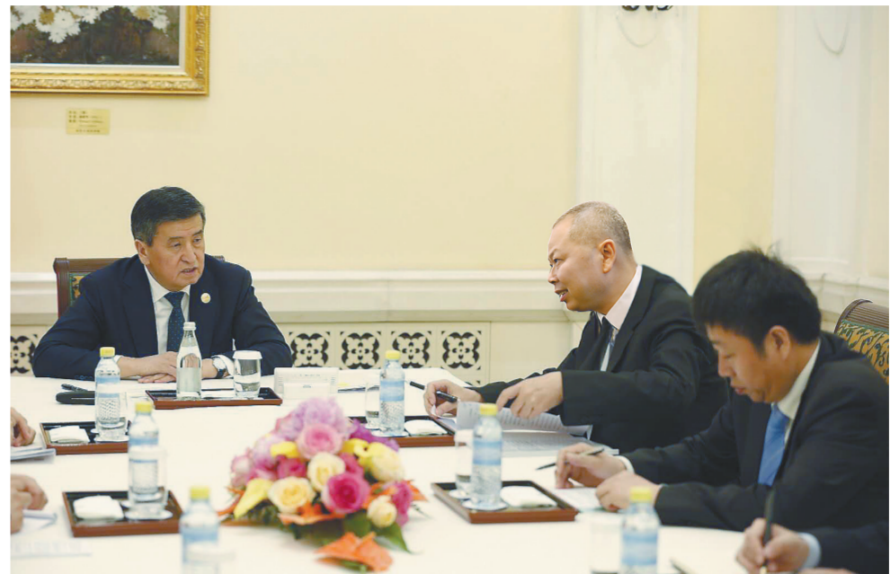
图为陈奋健与吉尔吉斯斯坦总统热恩别科夫亲切交谈。

本报北京4月26日讯(记者王 维 通讯员许 良)4月26日下午,中国铁建党委书记、董事长陈奋健在钓鱼台国宾馆会见来华出席第二届“一带一路”国际合作高峰论坛的吉尔吉斯斯坦总统热恩别科夫,双方就加强基础设施建设领域合作进行了深入交流。 吉尔吉斯斯坦外交部长、交通部长、总统办公厅政治部主任、国家铁路公司总裁、驻华大使会见时在座。 陈奋健首先代表中国铁建对总统阁下访华表示欢迎,并对总统阁下长期以来给予中国铁建的关心和支持表示感谢。陈奋健表示,中吉两国是友好邻邦,两国交往历史悠久,传统友谊深厚。近年来,吉尔吉斯斯坦在总