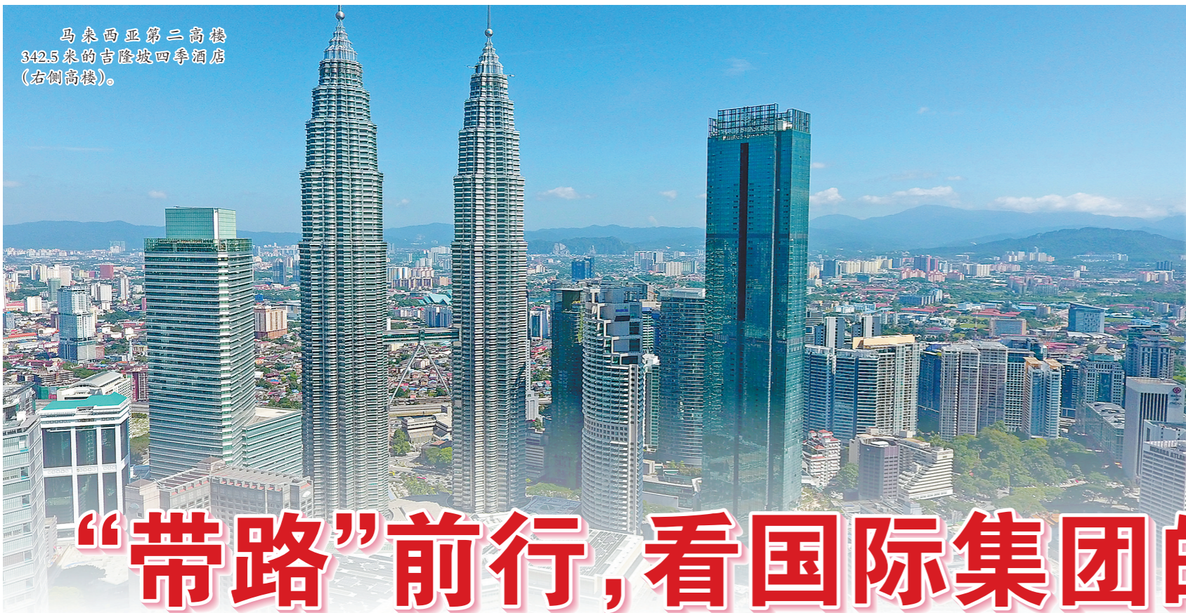
马来西亚第二高楼 342.5米的吉隆坡四季酒店 (右侧高楼)。