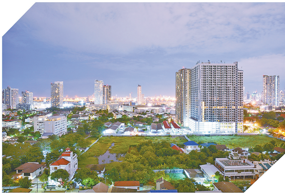
泰国曼谷阳光花园项目。