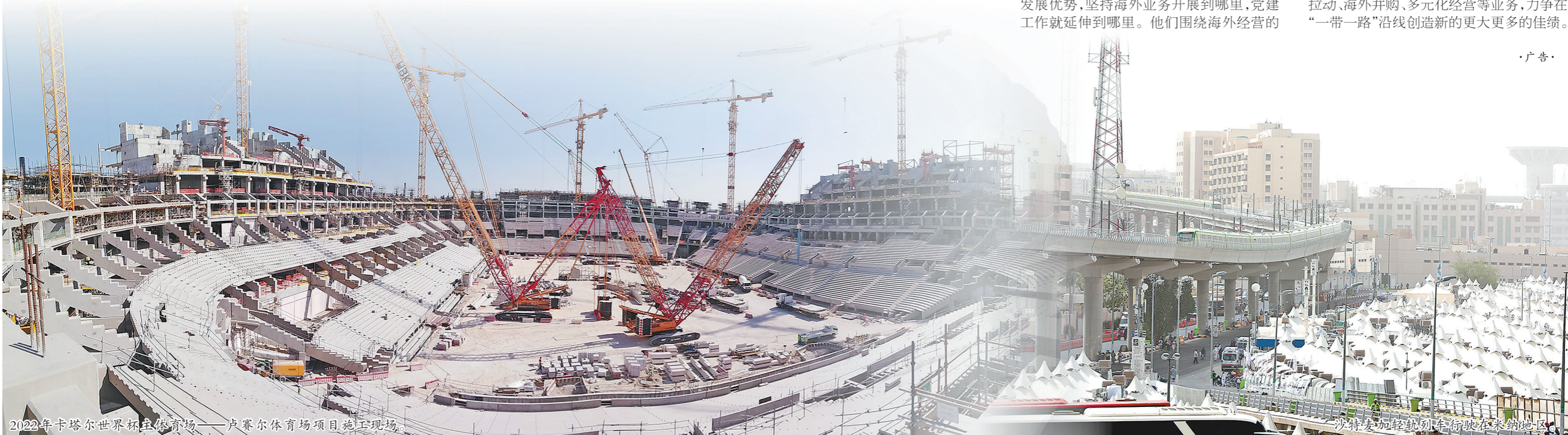
2022年卡塔尔世界杯主体育场——卢塞尔体育场项目施工现场。