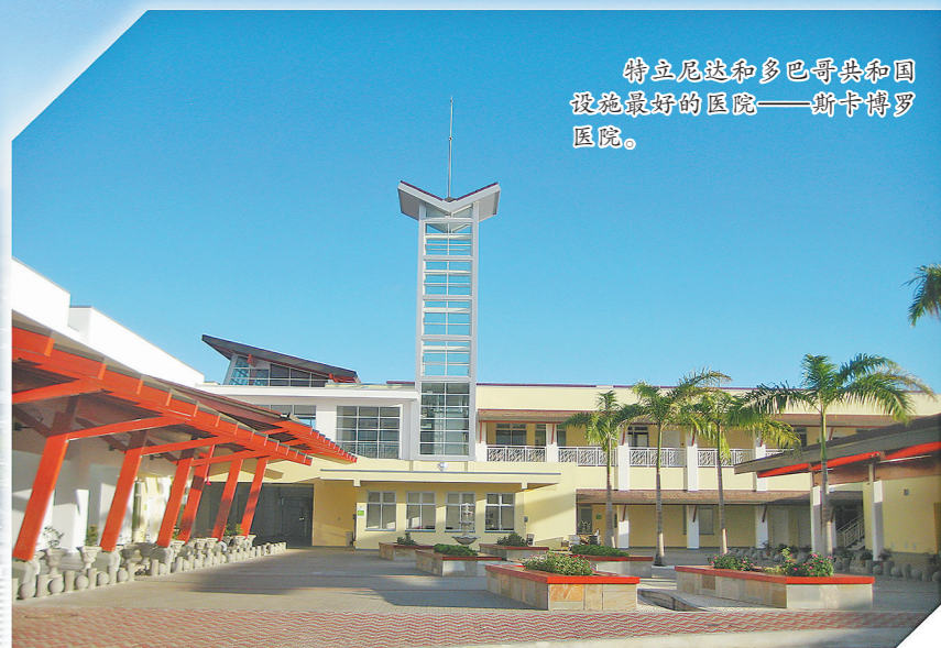
特立尼达和多巴哥共和国 设施最好的医院——斯卡博罗 医院。