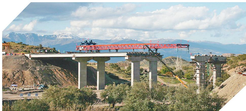
获得詹天佑奖的首个非洲工程——阿尔及利亚东西高速公路。

回首看,征程豪迈;展望处,宏图新开。中国铁建国际集团正借助“海外优先”战略的东风,在“一带一路”建设中展现着“国际范儿”,向着打造海外发展旗舰的目标破浪奋进。