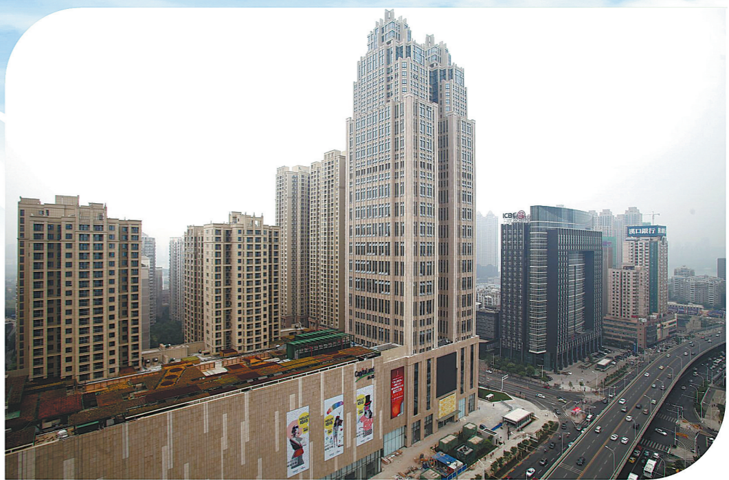
中铁十八局房地产公司开发的武汉1818中心。

党支部的湖南长轻置业党支部,牵头与总承包安公司长沙项目部、地方社区党总支联合组成区域党建联合党支部,以建设星级阵地、打造星级队伍、举办主题活动为载体,促进党建工作“标准化+区域化”,提升企业软实力和知名度。