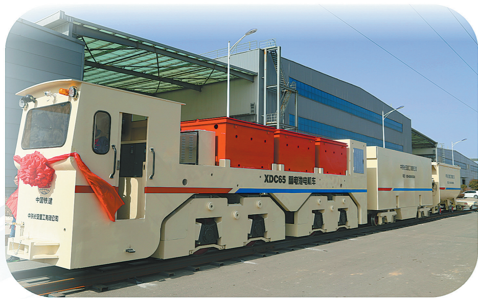
长安重工公司自主研发生产的65吨蓄电池电机组。

面向未来,长安重工公司将阔步前行,改革创新,锐意进取,为打造“品质铁建”和长安重工“强企富工”的愿景而努力奋斗!