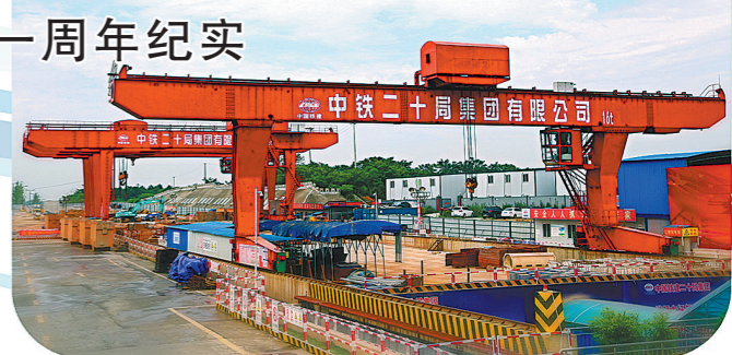
长安重工公司自主研发生产的MDG16吨L型单梁门式起重机。