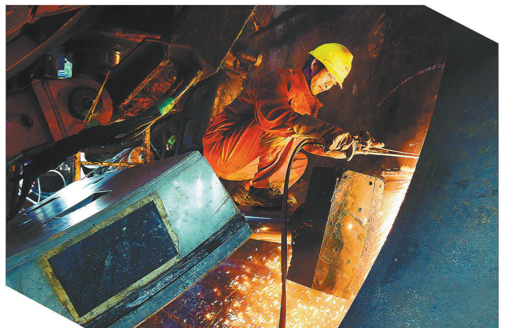
▶中铁十一局城轨公司成都地铁6号线项目部实现了国内首次富水砂卵石地层成功下穿地铁既有线并实现“零沉降”。图为盾构始发时紧张忙碌的施工情景。