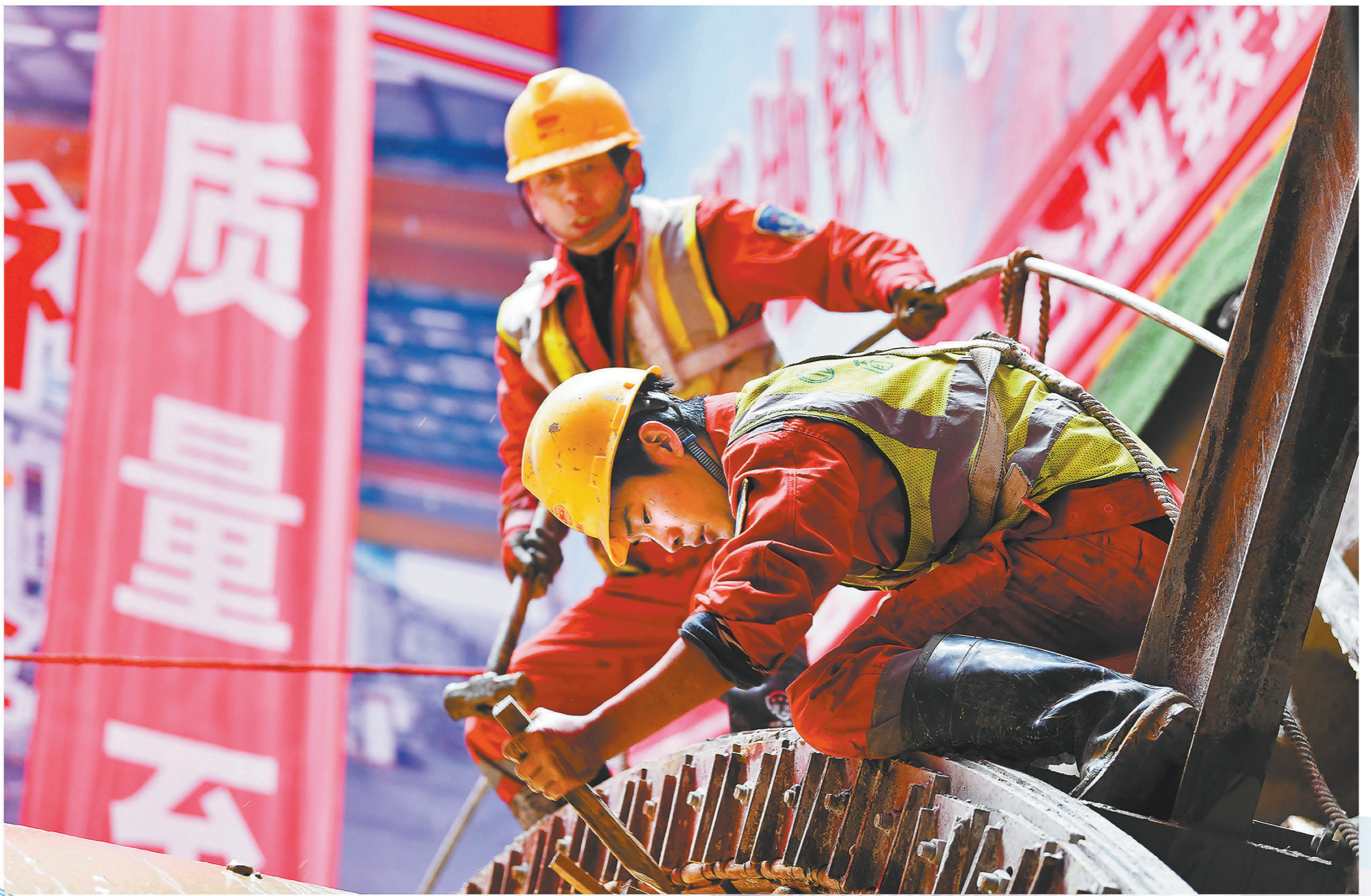
▲延长钢环技术可延长洞门空间,优化洞门密封,提前建立土仓压力 图为工人在填充延长钢环间隙。