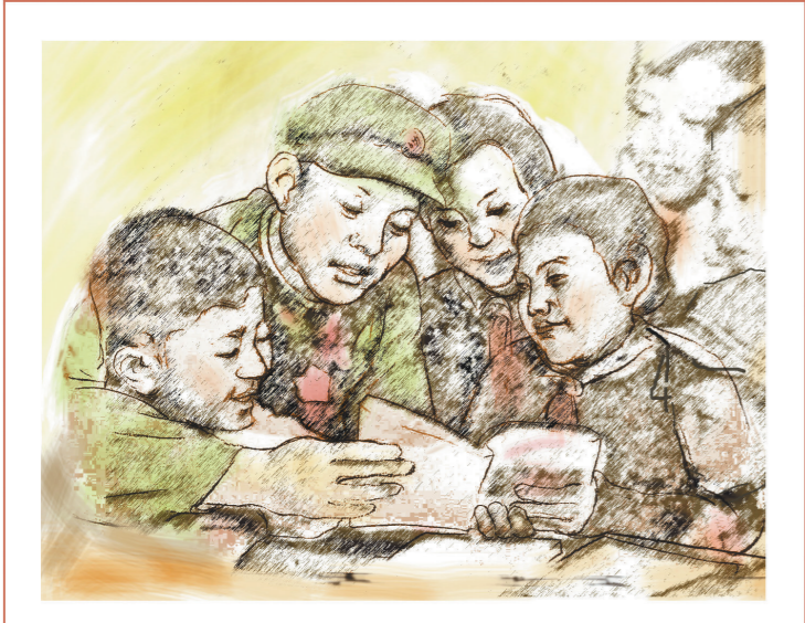
大爱的胸怀(素描淡彩)