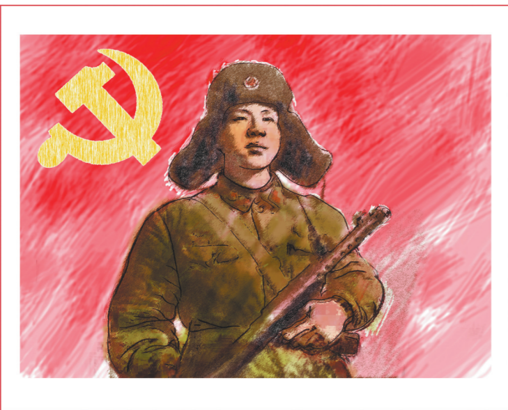
信念的能量(素描淡彩)