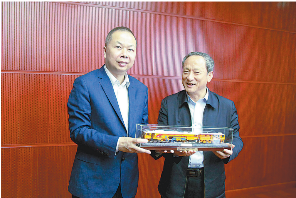
图为陈奋健向徐工集团党委书记、董事长王民赠送DWL-48连续走行捣固稳定车模型。

本报杭州3月8日讯(记者王 维 通讯员张 晶)3月8日下午,中国铁建党委书记、董事长陈奋健在中国铁建大厦会见徐工集团党委书记、董事长王民,双方就进一步深化在工程机械领域合作进行了深入交流,并达成共识。陈奋健表示,中国铁建是中国基建行业排头兵,徐工集团是中国机械行业排头兵。在国内外众多工程项目建设中,徐工集团以高质量的机械设备和优质高效的维保服务,