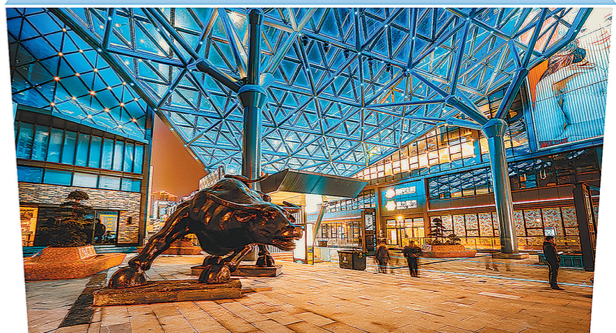
贵阳市西路环境综合整治工程

竞争在市场,竞争力在现场。在厦门宸洲洲际酒店装饰施工中,该公司强化细节管控,通过采取精准放线、环保无胶化收口、弧面造型硬包等诠释了其对一流品质的追求,受到业主高度评价。“其实,当时设计图纸对装饰打胶部分只做了常规的设计处理,但我们认为既然做就要做到最好。在施工过程中,我们对不同平面的转折处、不同材料的交界处等进行了不打胶处理,既提高了质量,也充分适应了绿色环保要求,给业主提供了远超现行规范的装饰品质。”该项目负责人介绍说。去年,厦门宸洲洲际酒店成为金砖国家厦门会议的指定接待酒店,这与该公司在装饰施工中打造“无胶工程”,提升绿色环保水平不无关系。从此,北京中铁装饰公司在华南市场牢牢站稳脚跟,并接连拿下深圳能源大厦、前海华润金融中心等装饰工程,实现了以现场赢市场。