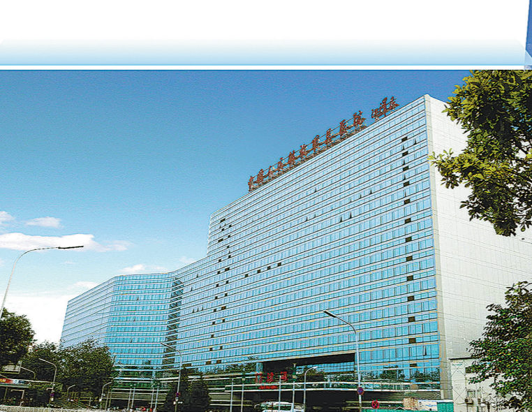
中国人民解放军总医院