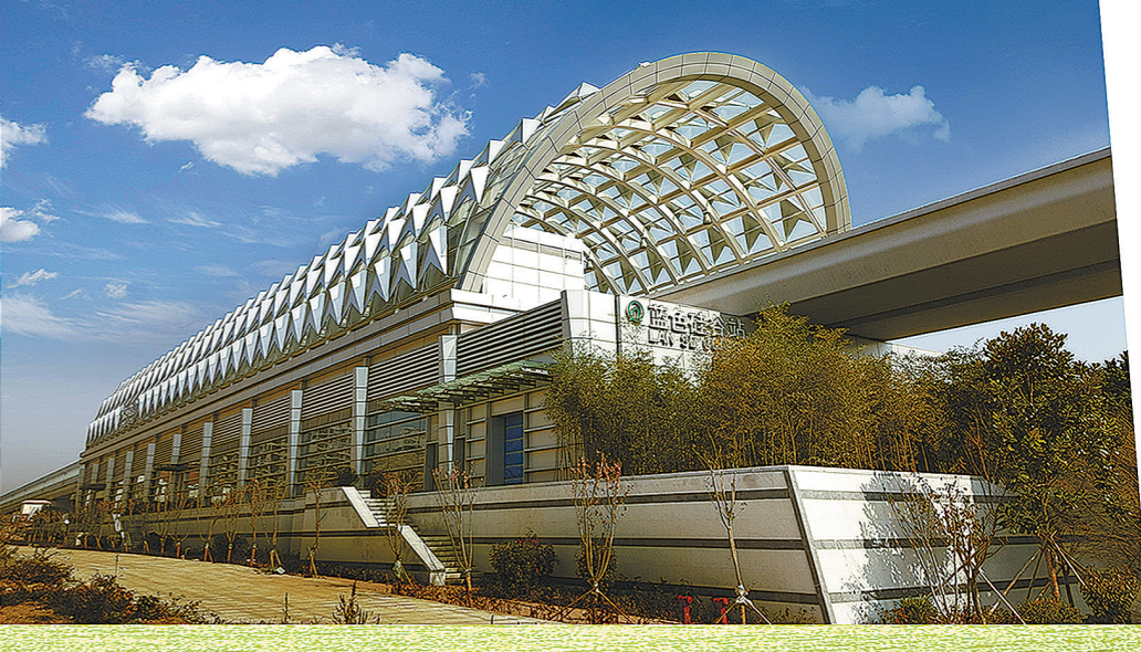
青岛地铁11号线蓝色硅谷站