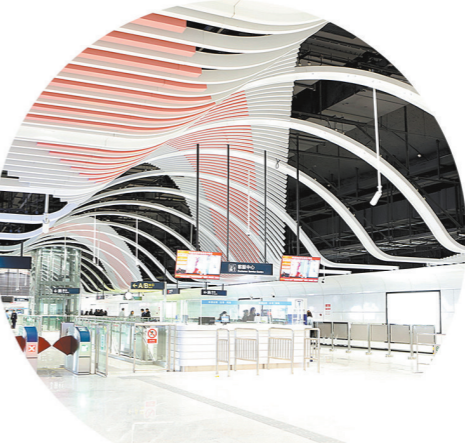
中铁二十局四公司承建的青岛地铁2号线李村公园站。

与此同时,2号线的建设者们也不甘落后,两个内部工班你追我赶,交替领先。2015年1月12日,全线第一家实现贯通;2016年7月30