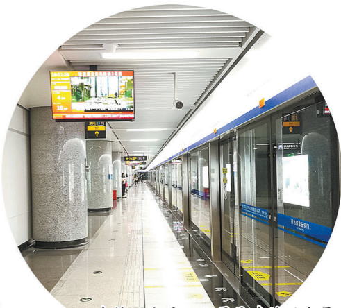
中铁二十局四公司承建的国内最大平行换乘站——青岛地铁3号线五四广场车站。