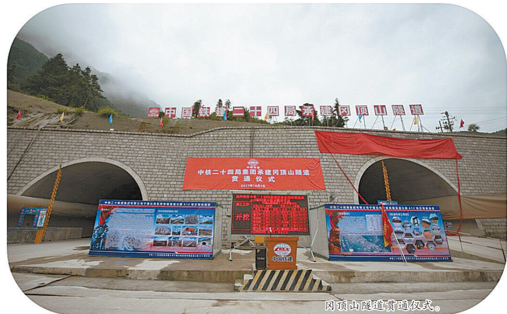
冈顶山隧道贯通仪式。

构建和谐项目部,为顺利完成施工生产任务提供强大的思想武器。在项目领导班子的带领下,大家心往一处想,劲往一处使。项目党工委针对工地偏远,职工思想波动较大的实际,及时发动党员开展“一带一帮”活动和形势任务教育,向职工