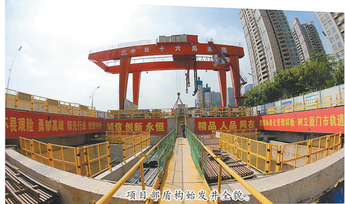
项目部盾构始发井全景。