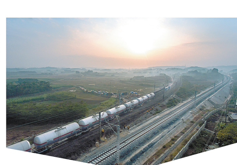
首趟列车满载货物行驶在南百增建二线铁路上。