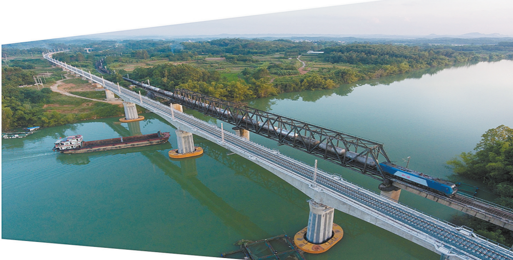
船和火车在马村桥相会。