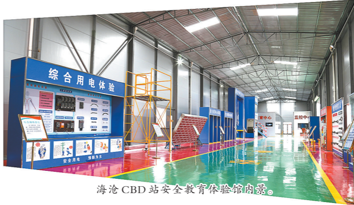
海沧CBD站安全教育体验馆内部。