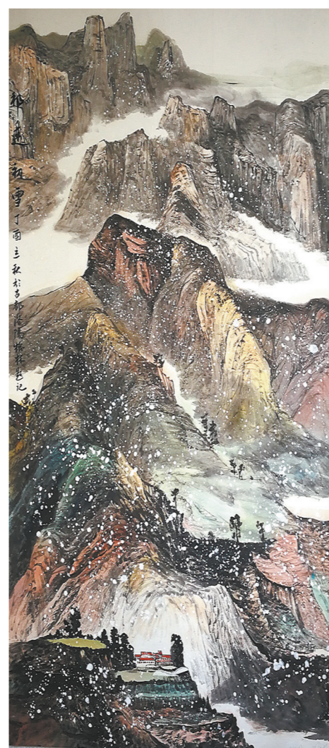
祁连初雪 (国画) 余怀林