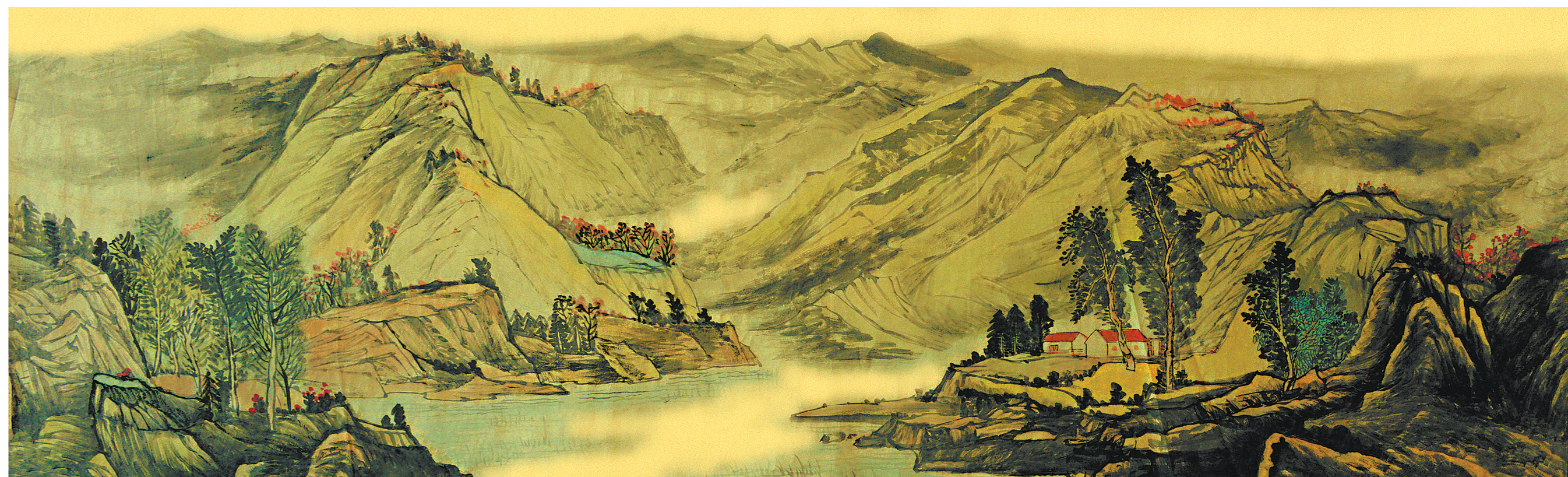
锦绣河山 (国画) 余怀林