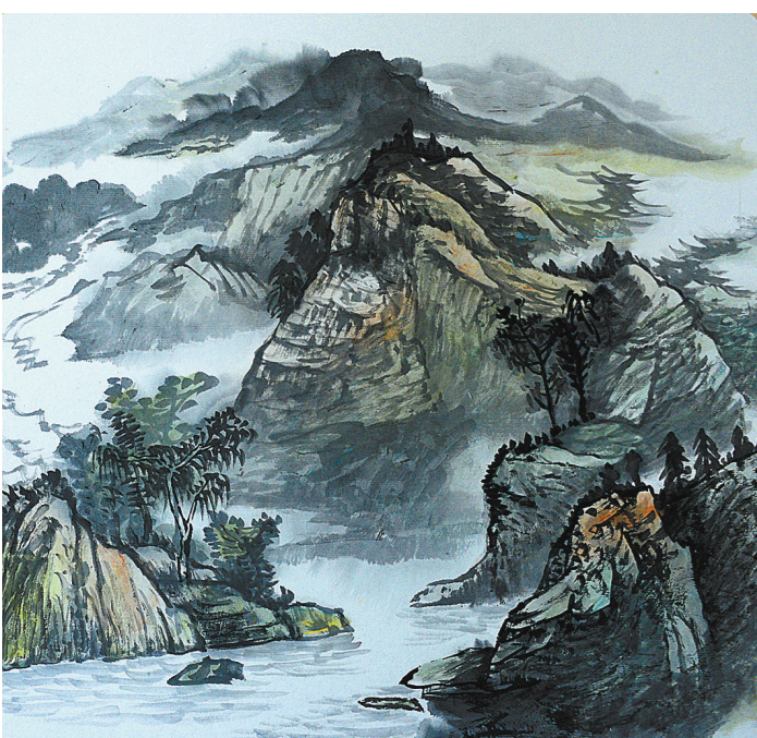
铁建工地沿线风情写生系列 (国画) 余怀林