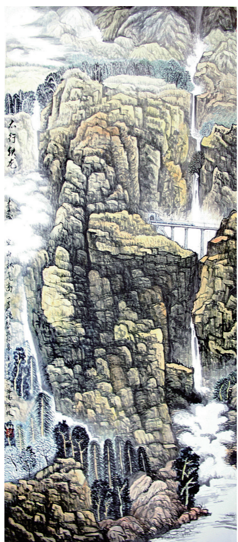
太行铁龙 (国画) 余怀林