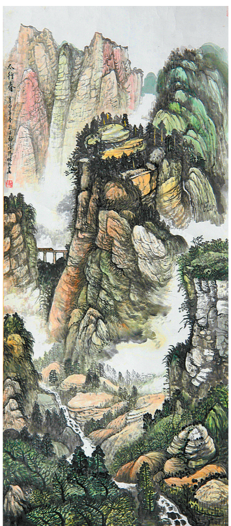
太行春色 (国画) 余怀林