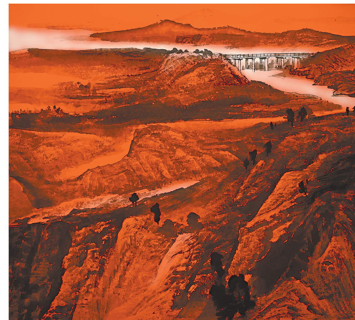
铁色高原 (国画) 余怀林